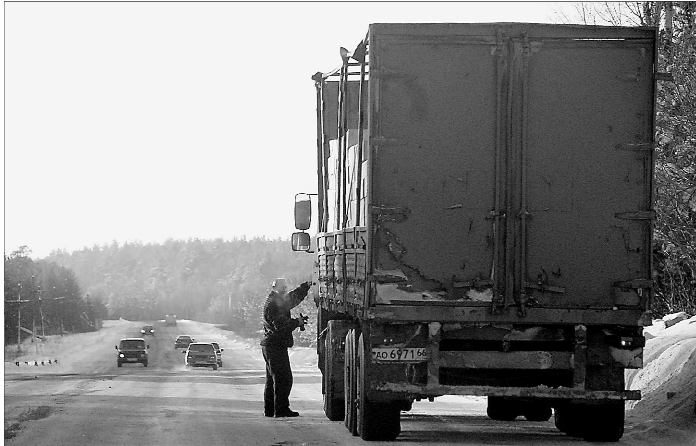
Сейчас на дорогах Среднего Урала решается, кто будет перевозить грузы для промышленности: у российских транспортников может не хватить ресурсов, чтобы достойно конкурировать с зарубежными коллегами.