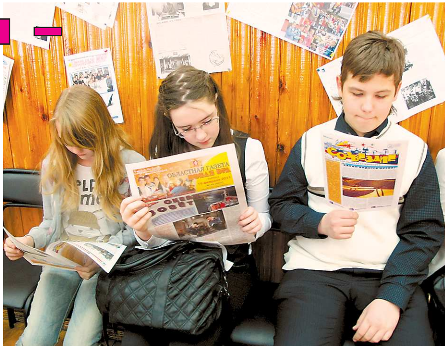
Когда юнкоры не пишут, они читают.