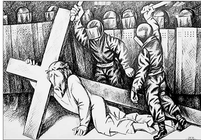
Из Евангельского цикла.

его фигур, передавая напряжение внутренней жизни, его динамику, её колоссальную энергию». Эта энергия сокрыта в каждой частице пластического текста Андрея Геннадьевича. И, наверное, поэтому камерные вещи, представленные на выставке, смотрятся столь монументально. Во всяком случае, всякий его Творский цикл умолять невозможно. Я восприняла его очень лич-