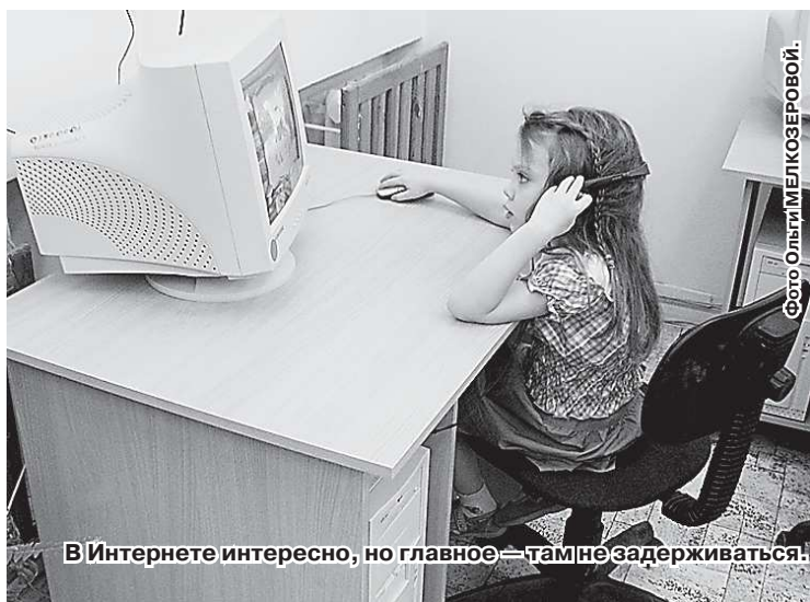
В Интернете интересно, но главное – там не задерживаться!

Иногда я сама не понимаю, что я там делаю. Для меня тот же самый «ВКонтакте» не является способом общения. Для этого есть аська, мэйл, наконец. А этот сайт... Он для меня, в основном, для просмотра фотографий. Многие там знакомятся, общаются, встречаются потом в жизни, да и, в конце концов, находят свои вторые