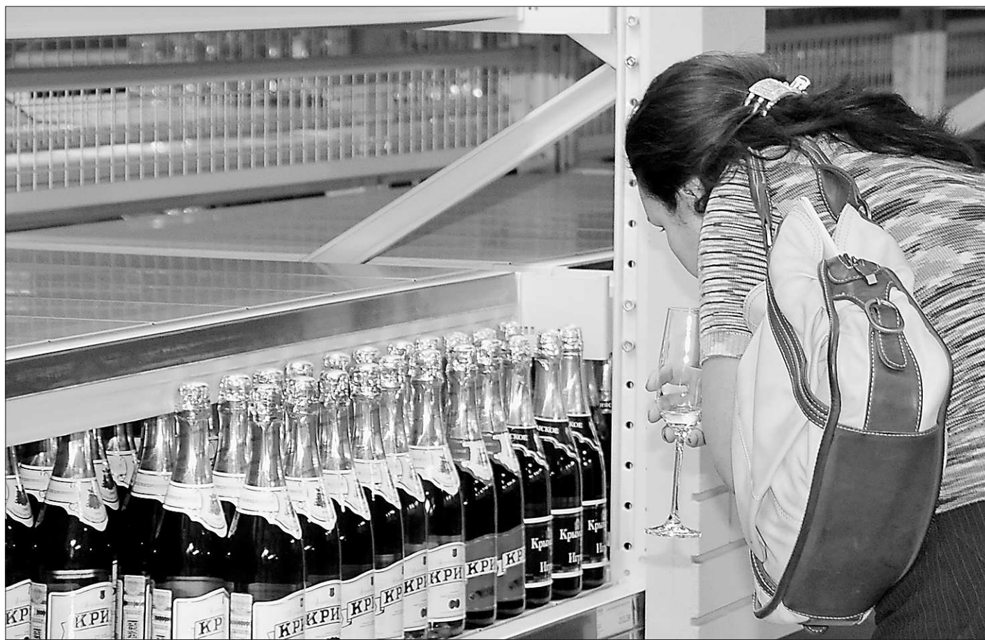
Пока есть из чего выбрать.

Поводом для обращения в суд стали результаты проверки, которые служба Росалкогольрегулирования проводила на этих предприятиях в конце прошлого года. В ходе их выяснилось, что часть данных об обороте этилового спирта, алкогольной и спиртосодержащей продукции на этих предприятиях не соответствовала тому, что отражалось в базе ЕГАИС – единой государственной автоматизированной информационной системе. Также выяснилось, что на Среднеуральском винзаводе пробы вина, взятые на экспертизу проверяющими, не соответствуют ГОСТу.