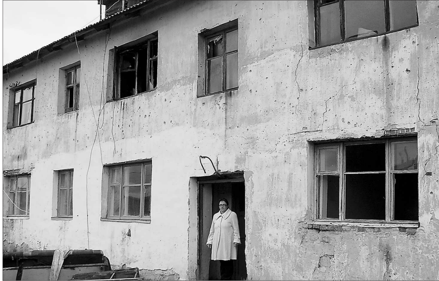
Таких пустующих домов в деревнях много.

В селе Усениновское, что в семнадцати вёрстах от Туринска, в своё время выстроили три дома на двенадцать квартир каждый. На сегодняшний день один из них заселён полностью, в другом разместились небольшой сельмаг, тре-