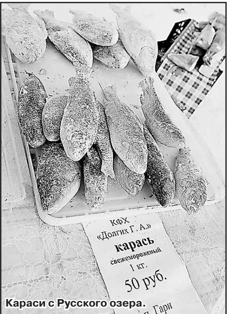
Караси с Русского озера. Тари

— Вы оттуда родом, что ли? Нет? Тогда, значит, очень давно там не были. Да, дома на озере стоят. А жителей в них нет: кто умер, кто уехал. Мы там избу