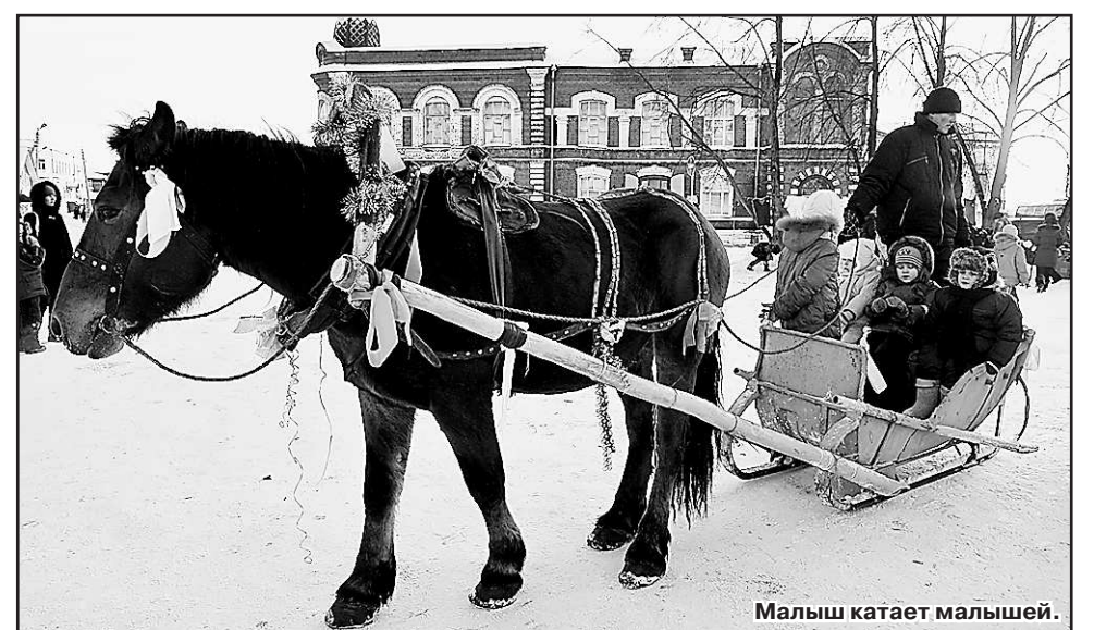
Малыш катает малышей.