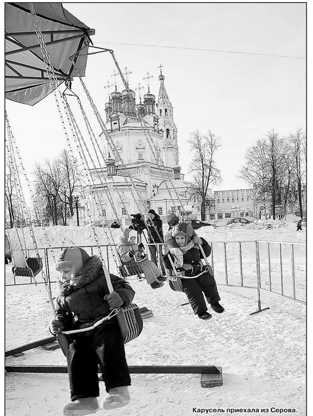
Карусель приехала из Серова.