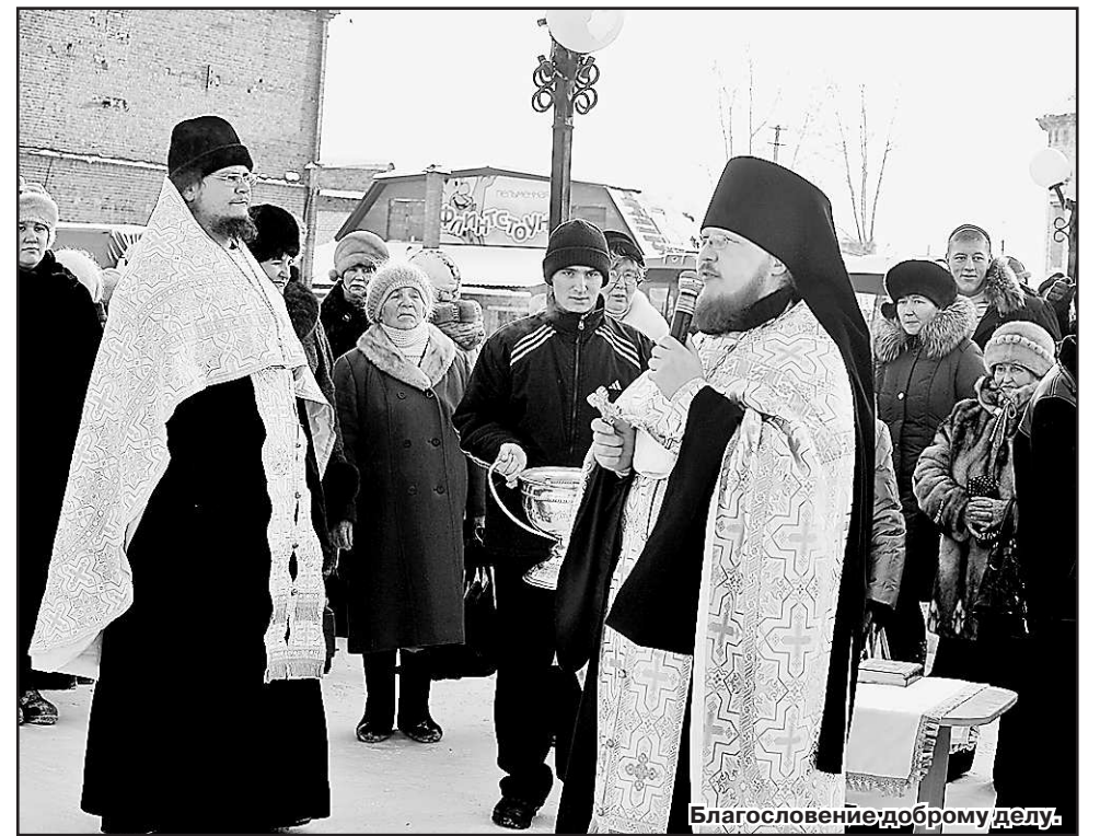
Благословение доброму делу.