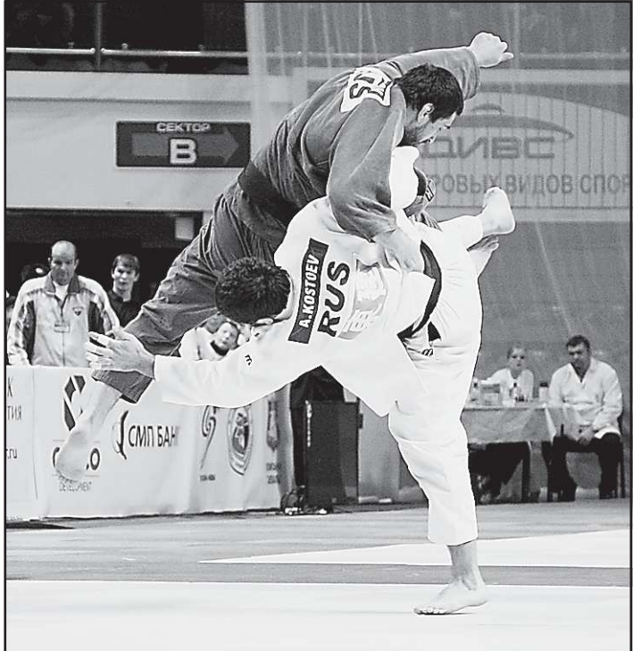
■ ВСЕ ДЕТИ — НАШИ