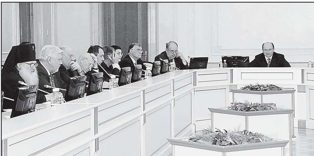
Итоги проведённой в 2010 году работы обсудили участники состоявшегося вчера в Екатеринбурге в резиденции губернатора заседания Общественной палаты Свердловской области.