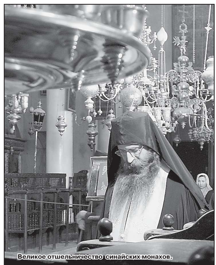
Великое отшельничество синайских монахов.