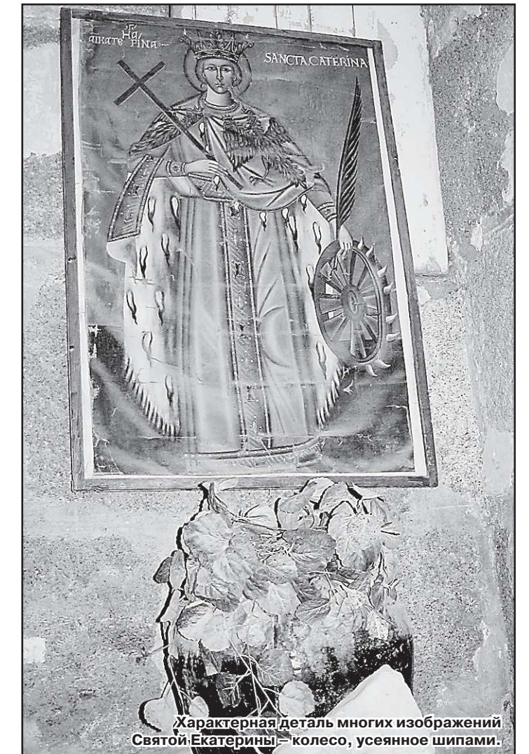
Характерная деталь многих изображений Святой Екаторины – колесо, усеянное шипами.

часам и минутам, еженевному бытованию, их посвященности однажды и навсегда одной возлюбленной деве сердца – Святой Екаторине. Святые отцы – её рыцари и пастыри. Веками хранят реликвию, освященные её именем – мощевик Святой Екаторины (тот, в котором первоначально находились обретенные мощи девы-великомученицы; сейчас в алтарной части храма – мощи в другом, менее помпезном ковчеге), а ещё – её лампаду, коптскую и византийскую иконы Святой Екаторины. И, конечно же, сами мощи. Это – самая почитаемая святая. Знаковая подробность: доступ к мощам Святой Екаторины еженедневно открыт для всех верующих, тогда как братья Синайского монастыря имеют право и возможность прикоснуться к святыне только в определённые, праздничные дни. И тут – духовная аскеза. Малопопятная