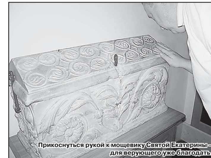
Прикоснуться рукой к мощевику Святой Екаторины – для верующего уже благодать.

для неверующих, но опять же – притягательная, внушающая глубочайшее уважение самим фактом незыблемости ритуала, церковного канона. Аскетичный мир святых отцов Синая отличен от нашего. Но в таком случае что же, что танет нас сюда, если, оставив блага цивилизации, тысячи людей веками устремляются к тропе Моисея, Неопалимой купине, Синайской обители?