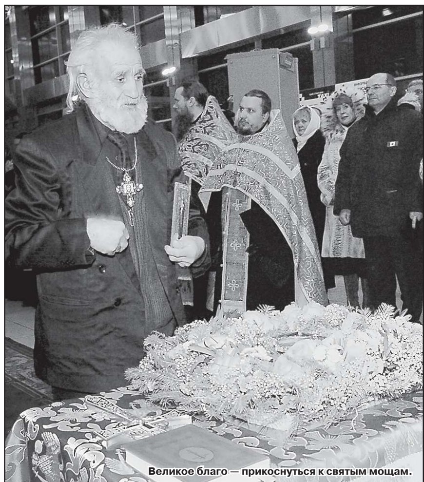
Великое благо – прикоснуться к святым мощам.

Екатерины, приходящие получают наконец долгожданную возможность поклониться устам святыни, прикоснуться устами к