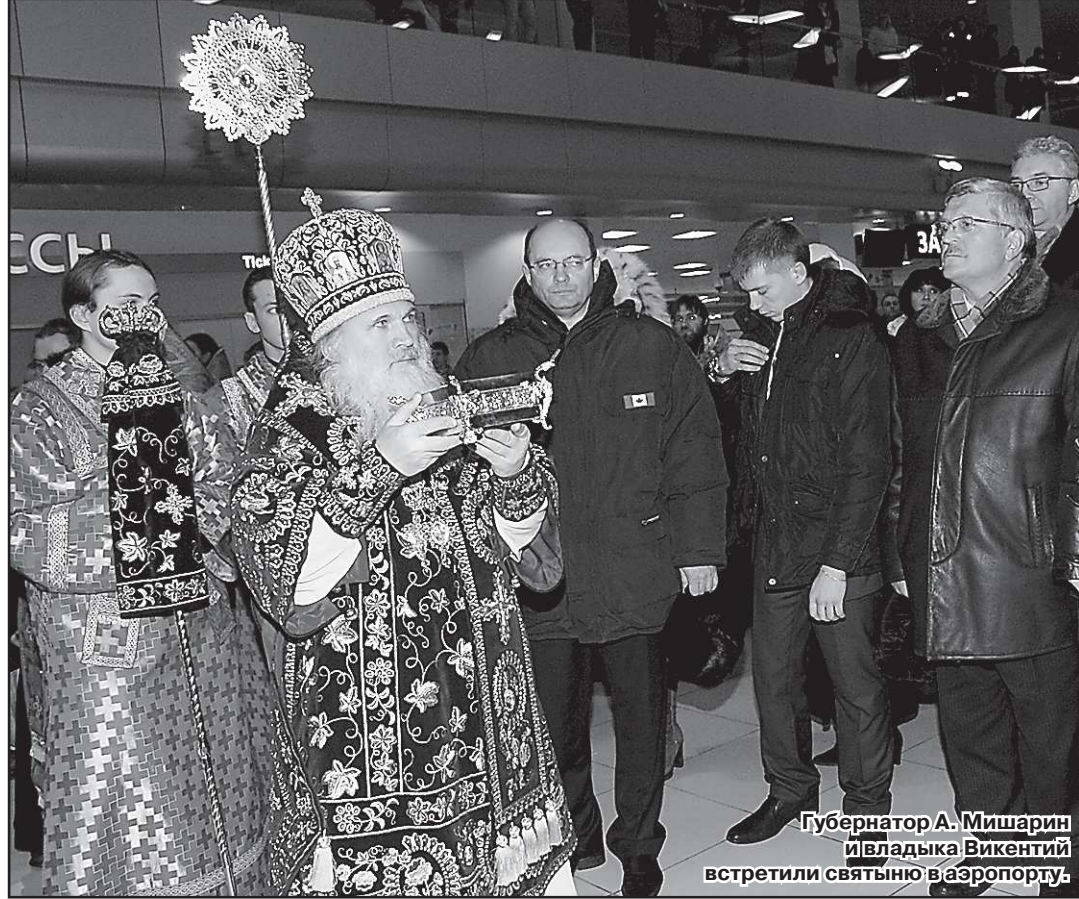
Губернатор А. Мишарин и владыка Викентий встретили святыню в аэропорту

Святой Екатерины, уральцы движутся по улице Куйбышева к Свято-Троицкому кафедральному собору. По пути присоединяются люди – ещё и ещё... У Свято-Троицкого кафедрального собора, на территории храма, святыню встречают не только священники, паства, но и вполне светский почётный эскорт военных. «Смирно!» – вполголоса раздаётся команда. Святыню вносят в собор, и архиепископ Екатеринбургский и Верхотурский Викентий и Верхотурский Викентий начинают службу – с молебном, чтением святого Евангелия, милопомазанием верующих, после чего представители духовенства, Братства Святой