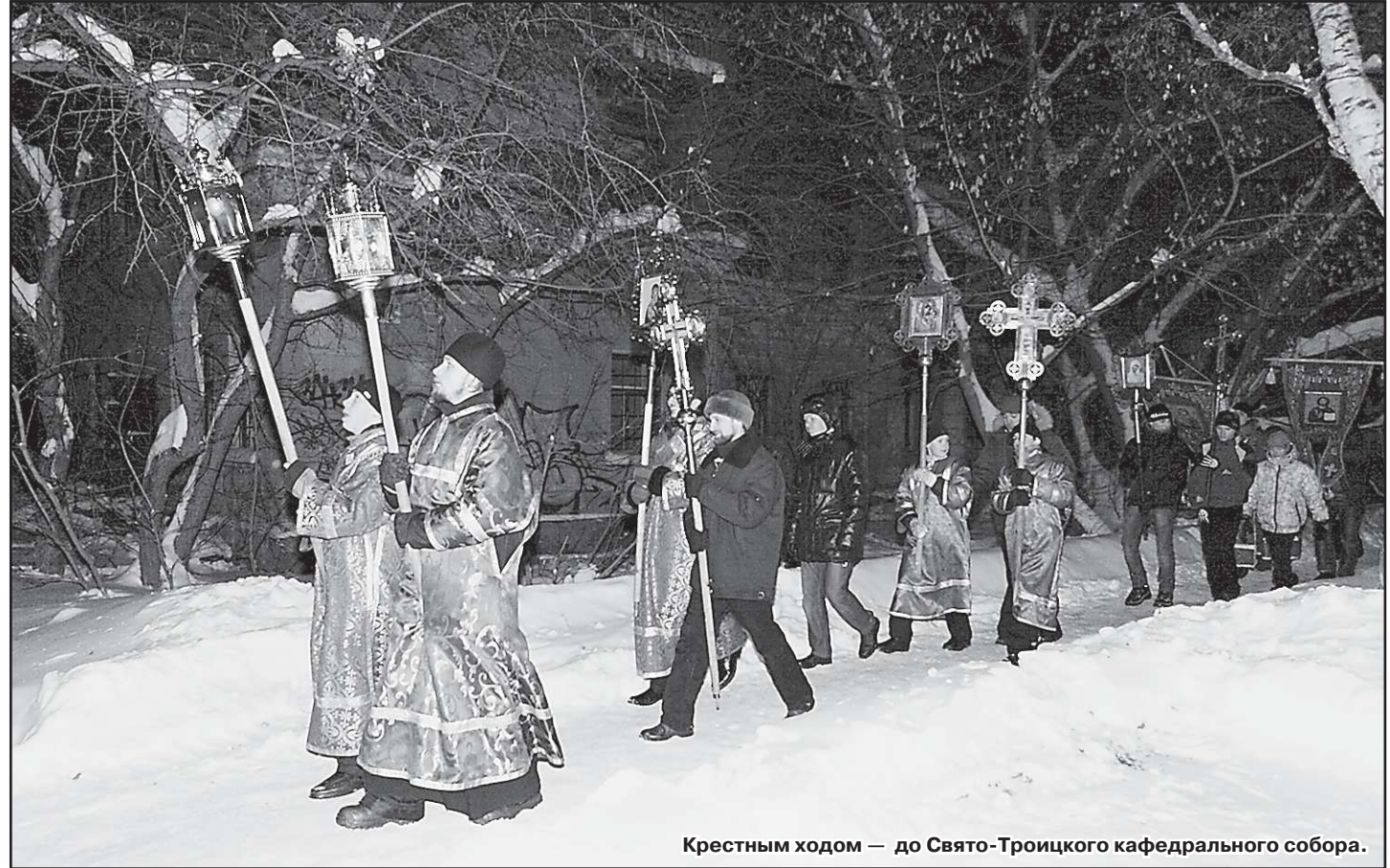
Крестным ходом – до Свято-Троицкого кафедрального собора.

Ирина КЛЕПИКОВА.