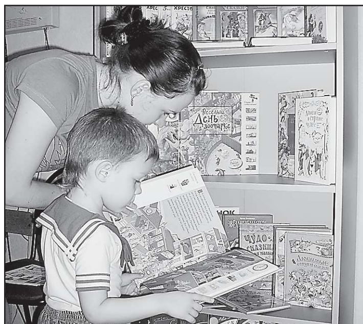
Самые главные волшебники у датского сказочника — девочки и мальчики, которые совершают чудеса любви и преданности, стойкости и отваги. Бывает, что Андерсен вдохновляет и на творчество. Вот строчка из детского стихотворения: