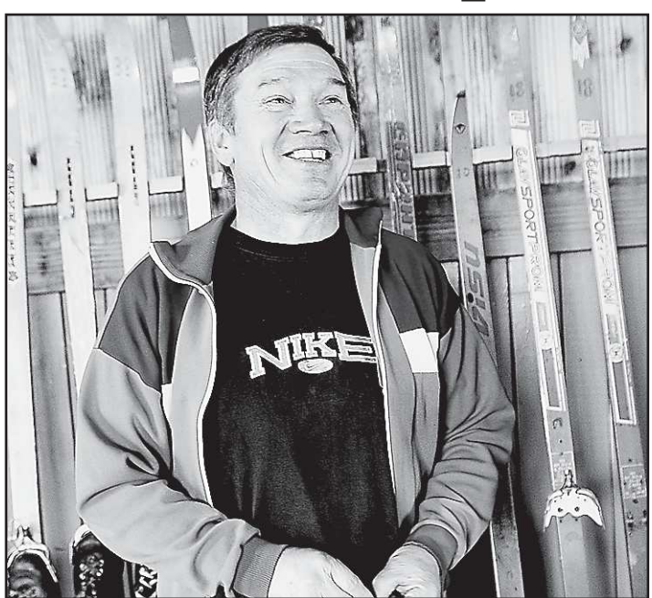
методику занятия так, чтобы задействовать всех.

И здесь проявляется ещё один плюс «Родника» как специализированного учебного заведения. Если инвалид в группе один, то его во время урока подсаживают куда-нибудь в уголок, чтобы не пугался под ногами, здесь же преподаватель подбирает