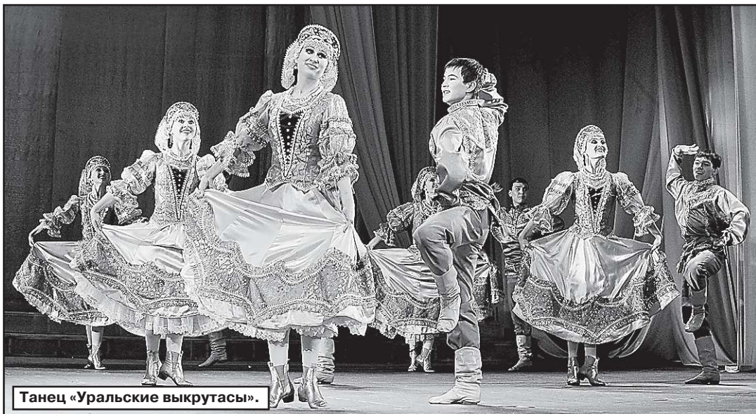
Танец «Уральские выкрутасы».