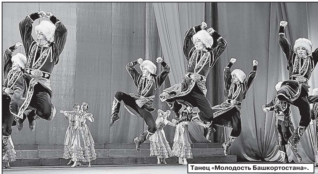
Танец «Молодость Башкортостана».