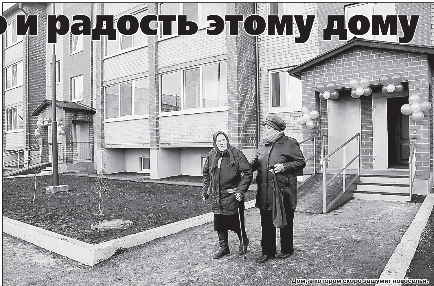
Дом, в котором скоро зашумят новоселья.

Ключей не давали, но праздник был и праздничное настроение тоже. Пышминцы, прознав про событие, пришли поздравить