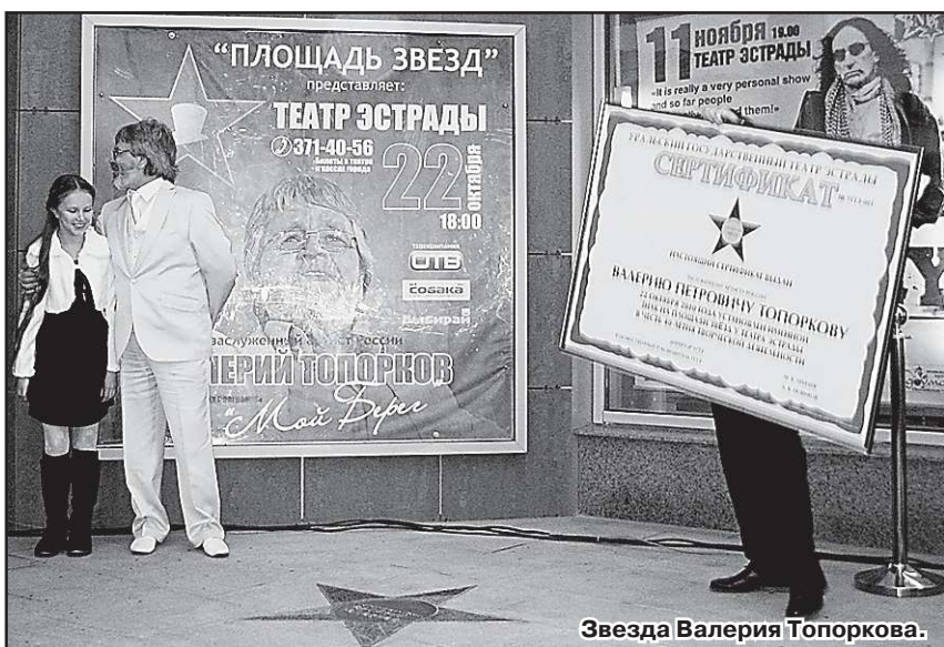
Звезда Валерия Топоркова.

Площадь эстрадных звёзд заложена в Екатеринбурге. Первой «зажглась» пятиконечная бронза заслуженного артиста России Валерия Топоркова. Всё было так, как и подобает в подобных ситуациях: белый лимузин, красная дорожка, фейерверк, вином торжества с оной дочерью. Перед Театром эстрады, где и произошла закладка звездной площадки, было темно от плотной толпы поклонников творчества Валерия Топоркова, пришедших разделить с ним радость исторического момента. Они с явным удовольствием «перелистывали» странички его песенной биографии, благодаря большому экрану у входа, где мелькала его выступление на различных песенных фестивалях, конкурсах, победителем которых он неоднократно становился. Событие приурочили к 40-летию творческой деятельности артиста: за это время он дал более трёх тысяч концертов в сотнях городов страны и на десятках зарубежных сцен, исполнил около тысячи песен, поработал с сотней дирижёров.