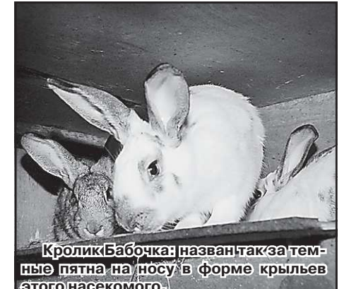
Кролик Бабочка: назван так за темные пятна на носу в форме крыльев этого насекомого.

Хотя, по-моему, красота, уникальность, неповторимость всегда окружали её на протяжении этих последних восьми лет. Не так