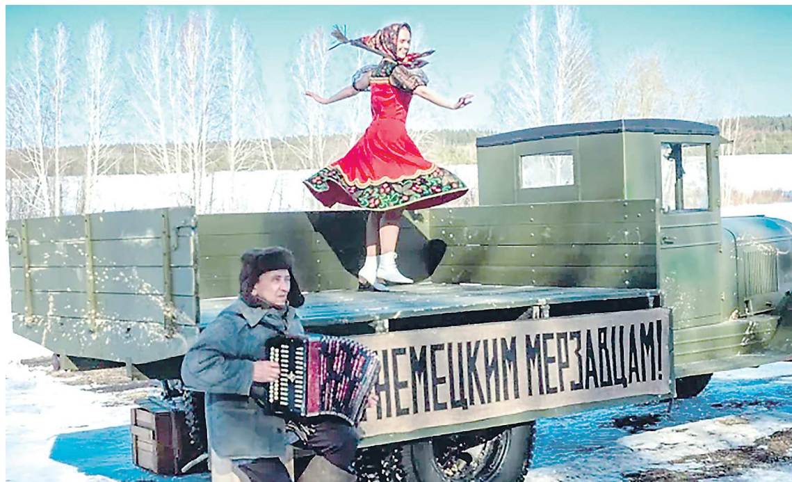
В съемках задействованы артефакты времен Великой Отечественной войны, например, легендарный грузовик ЗИС-5