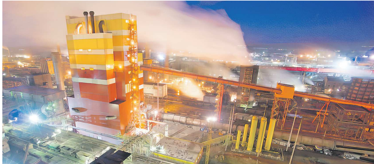
Промышленные гиганты завораживают своей технологической эстетикой

В доменном цехе вы увидите уникальную, самую чистую в российской металлургии до-