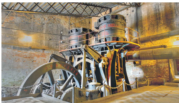
ЦЕНТР РАЗВИТИЯ ТУРИЗМА СВЕРДЛОВСКОЙ ОБЛАСТИ