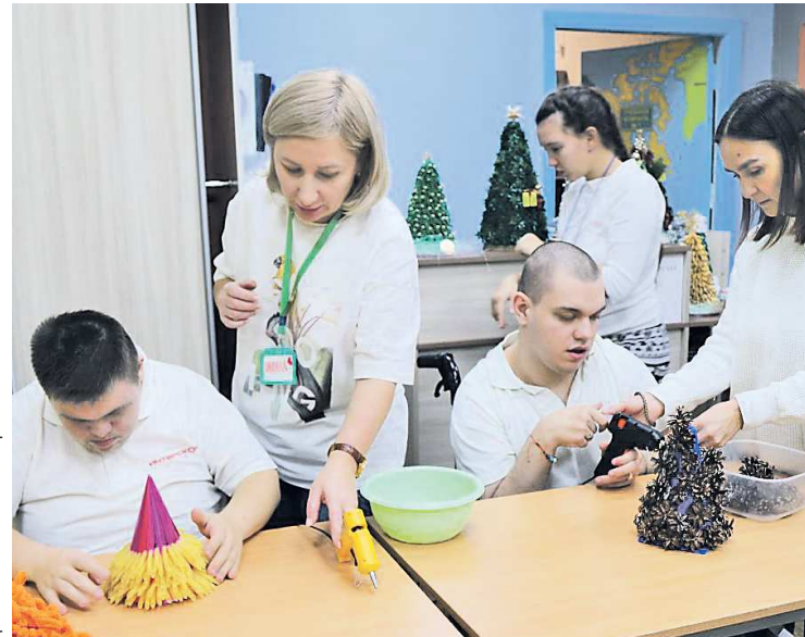
НКО «Сейчасъ» в Березовском благодаря гранту продолжит работу мастерской по рукоделию

Напомним, в прошлом году по итогам двух конкурсов свердловчане смогли привлечь из Фонда президентских грантов более 200 миллионов рублей на реализацию 90 проектов.