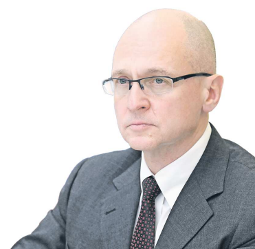
Сергей КИРИЕНКО, первый заместитель руководителя администрации Президента России

“ Это у нас 17-й конкурс Фонда президентских грантов. Приняли решение о том, что получают поддержку 1 тысяча 559 проектов из 84 регионов нашей страны на общую сумму 4 млрд 365 млн рублей. Это только федеральное финансирование по федеральному конкурсу. Самый большой грант – 63 млн рублей – в этом году получает Русфонд на создание регистра доноров костного мозга для тех пациентов, кто не может рассчитывать на родственную трансплантацию. Список из 15 тысяч новых потенциальных доноров будет сформирован за счет средств этого гранта.