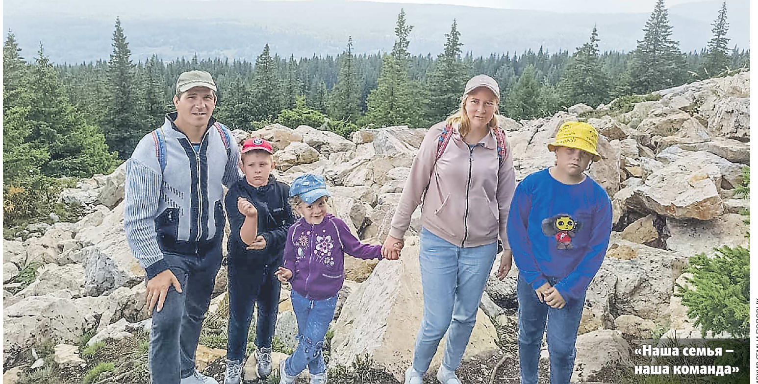
«Наша семья – наша команда»