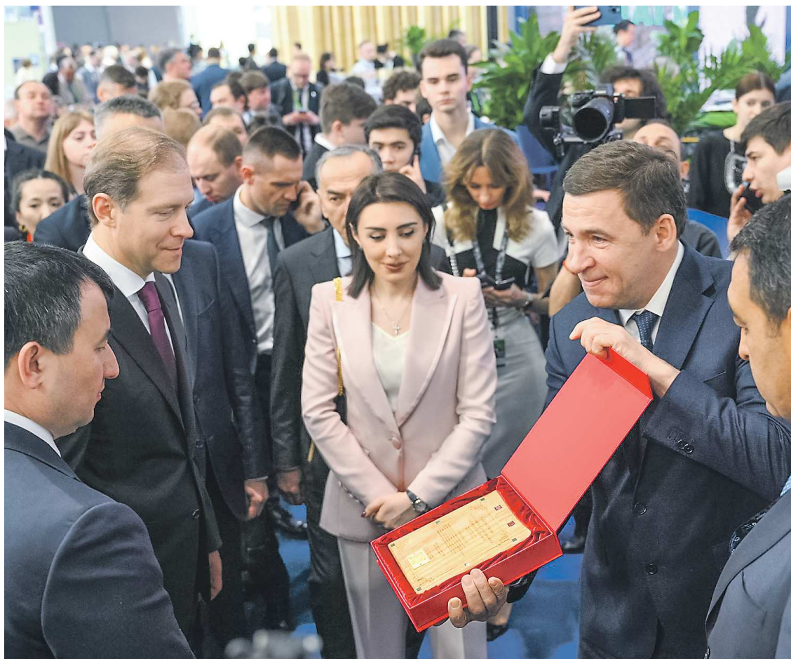
Евгений Куйвашев пригласил вице-преьера – главу Минпромторга РФ Дениса Мантурова и заместителя премьер-министра Узбекистана Жамшида Ходжаева на Международную неделю моды UF LAB в Екатеринбурге