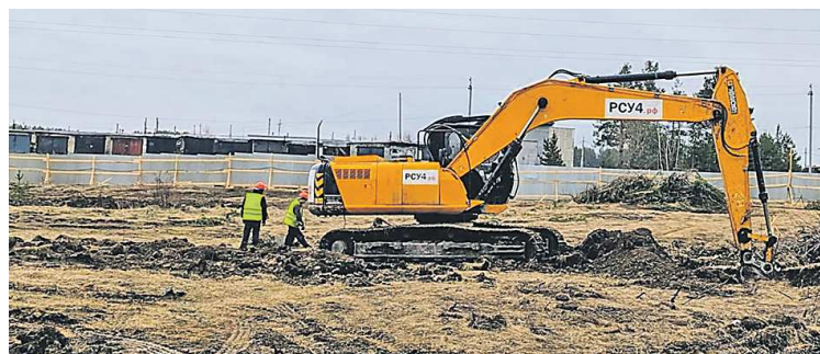
На площадке строительства поликлиники в Режевском ГО готовятся к укладке фундамента

На площадке новой поликлиники в Артёмовском строители приступили к возведению первого этажа здания. Уже завершены устройство фундамента, гидроизоляция и утепление наружных стен подвала. Про-