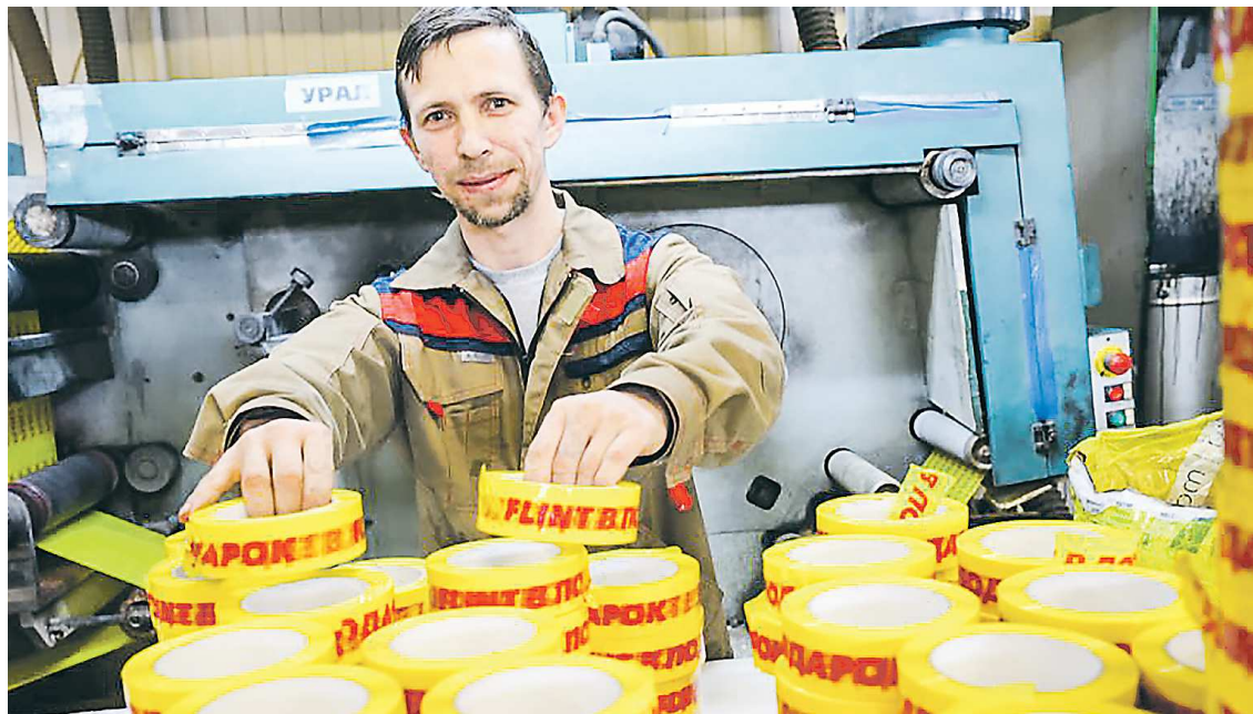
В этом году на предприятии «Брендлента» планируется установить третью линию для выпуска клейкой ленты