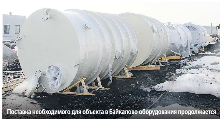
Поставка необходимого для объекта в Байкалово оборудования продолжается

Первая попытка построить станцию очистки воды была еще в 2018 году, но недобро-