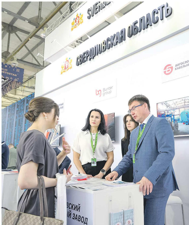
На стенде нашего региона на выставке «ИННОПРОМ. Центральная Азия» представлено 10 компаний: производители металлургической, машиностроительной, электротехнической продукции, разработчики передовых решений в сфере автоматизации производственных процессов

По словам губернатора Евгения Куйвашева, у Свердловской области установлены с партнерами из Центральной Азии коопе-