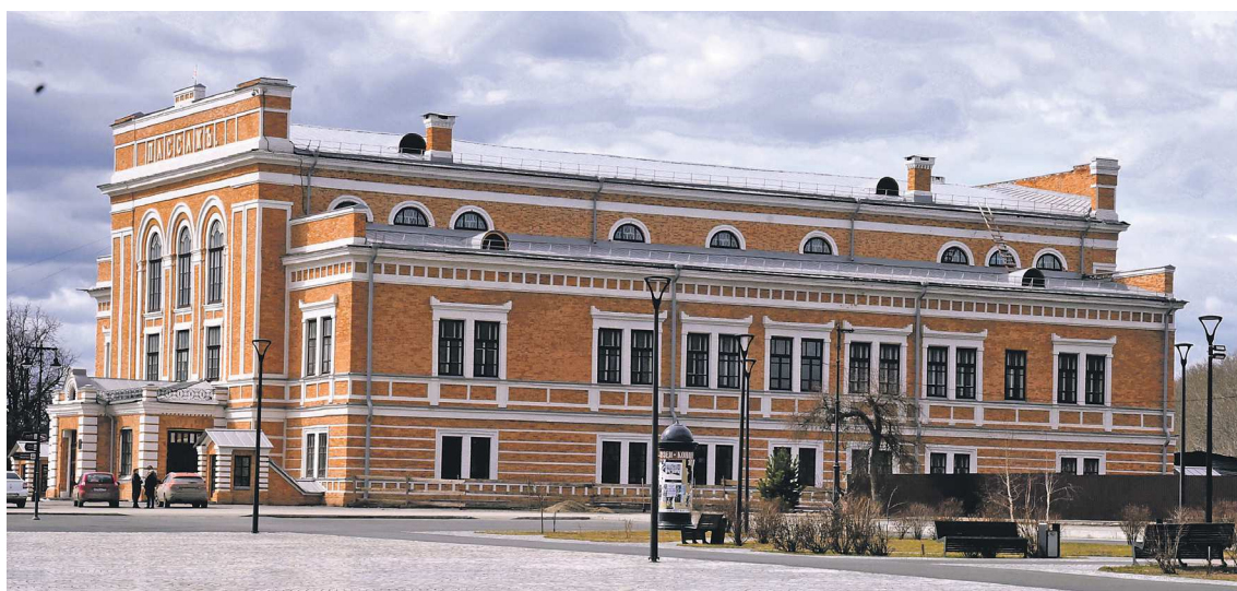
Пассаж, один из символов Ирбита, откроется после реставрации в 2026 году

ный жилой дом – планируем построить до конца текущего года: 35 квартир в нем будут предоставлены жильцам аварийных домов, 9 – врачам, 9 – педагогам.