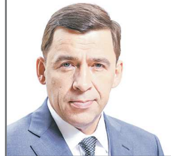
Губернатор Свердловской области