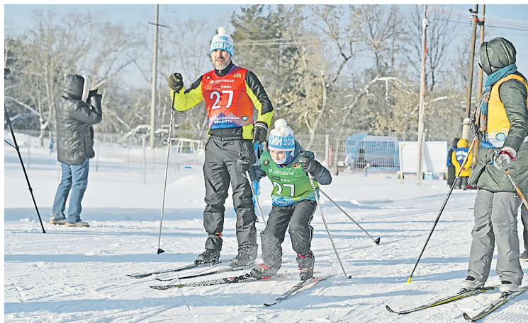
Одним из самых любимых видов спорта у свердловчан остаются лыжные гонки

Он отметил, что физическая активность стала нормой для более 61% свердловчан. Среди взрослого населения популярны: спортивное программирование, фитнес и игровые виды спорта. А также, катание на лыжах, на велосипеде, пробежки на свежем воздухе.