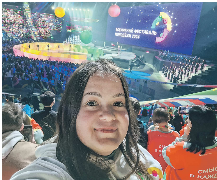
Открытие Всемирного фестиваля молодёжи – незабываемый момент