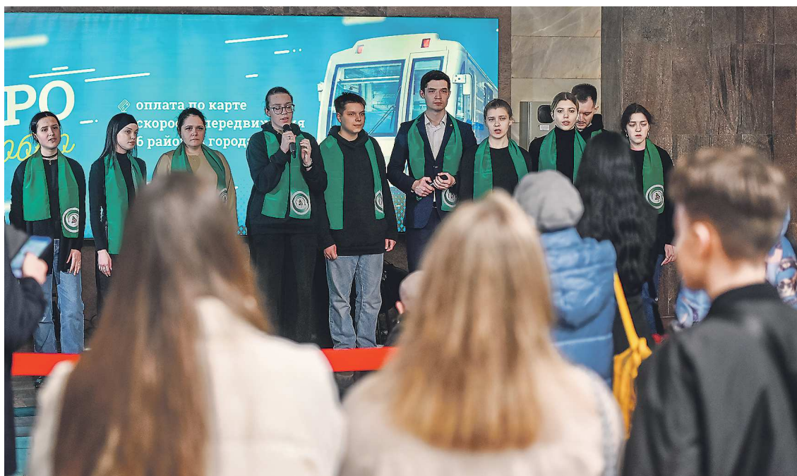
Легендарные «Журавли» звучат в екатеринбургском метро в память о погибших в «Крокус Сити Холле»

Кроме того, в центре города жители выложили надпись «Екатеринбург скорбит» из четырех тысяч свечей. В этой акции приняли участие представители Регионального центра патриотического воспитания, областных отделений «Молодой гвардии Единой России», «Офицеров России», «Российских студенческих отрядов», молодежной организации «Регион возможностей», движения «Волонтеры Победы».