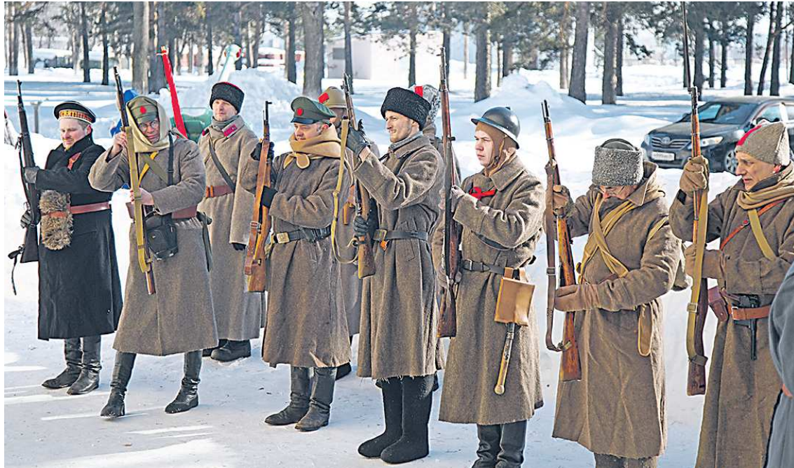
Отряд красноармейцев настроен решительно

Красная армия фактически была создана 23 февраля 1918 года, когда началась массовая запись добровольцев в ее отряды. Именно поэтому в советское время праздник 23 февраля назывался Днем Советской армии. Задачу воссоздать первые бои новообразованной Красной армии против сильнейших войск Кайзеровской Германии поставили перед собой реконструкторы, участники различных исторических клубов области. Они были одеты в военную форму начала XX века, а в руках держали соответствующее тому времени оружие. Еще одним маркером эпохи, подчеркнутым реконструкторами, явилась политизированность населения России накануне гражданской войны. В отряде «красноармейцев» можно было легко различить, например, анархиста, одетого в характерную черную форму и провозглашающего соответствующие идеи.