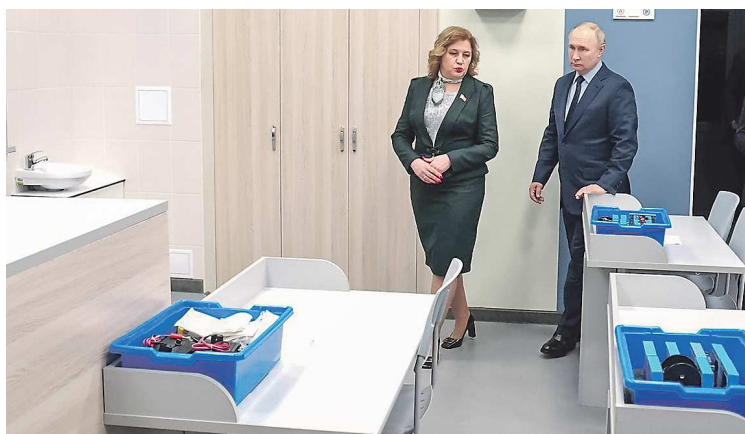
Президент осматривает кабинет физики в школе №32