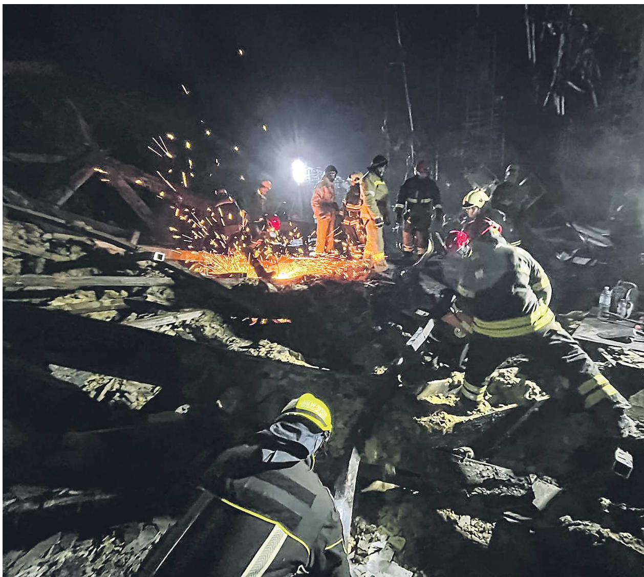
В разборе завалов принимают участие четверо свердловчан, прошедших специальную подготовку

ВСЕРОССИЙСКИЙ СТУДЕНЧЕСКИЙ КОРПУС СПАСАТЕЛЕЙ