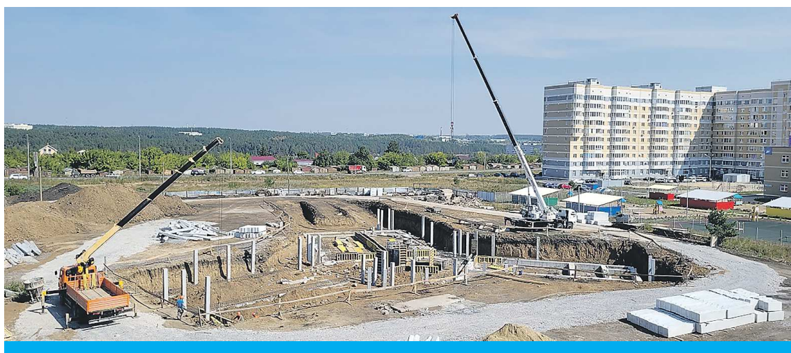
ПРЕСС-СЛУЖБА АДМИНИСТРАЦИИ КАМЕНСКА-УРАЛЬСКОГО