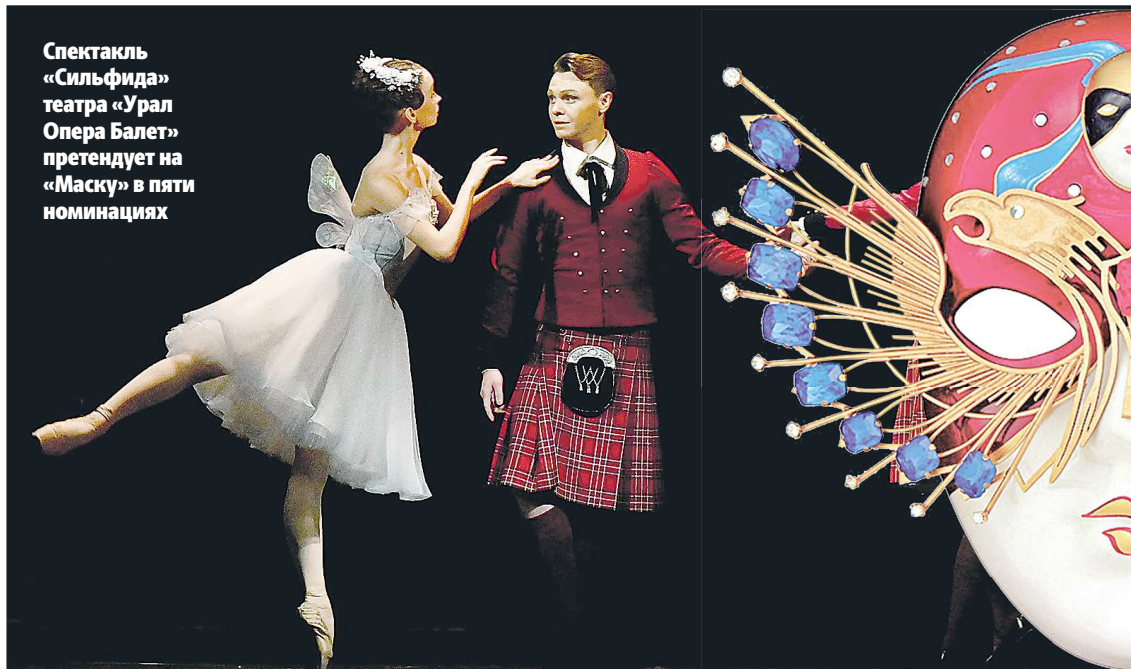
Спектакль «Сильфида» театра «Урал Опера Балет» претендует на «Маску» в пяти номинациях

Изменения коснулись нескольких аспектов проведения премии «Золотая маска», но самое существенное – это логистическая перемена. Мы уже привыкли, что коллективы, получившие номинацию на «Маске», приезжают на финальный показ в столицу. Теперь участники будут показываться на родных сценах. Причина простая: прежнее руководство не получило необходимого финансирования, ведь чтобы привезти более 50 спектаклей в Москву – нужны внушительные средства. Но есть и плюсы, так как на своих сценах артисты точно предстанут во всей красе, не нужно будет подстраиваться под новое пространство.