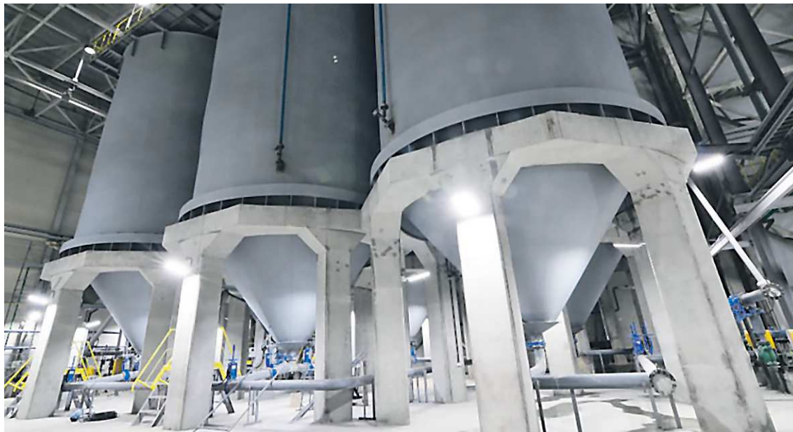
Продукция завода пользуется повышенным спросом как в Свердловской области, так и за ее пределами

«АТОМ Цемент» построен при поддержке правительства Свердловской области. Он входит в число приоритетных инве-