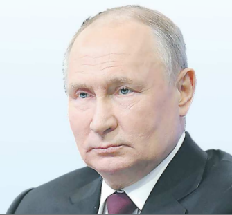
Владимир ПУТИН, Президент России

“ Пусть новый 2024 год, объявленный в России Годом семьи, приумножит достигнутое, принесет в каждый дом душевное тепло, радость и счастье, подарит множество ярких моментов, праздников и встреч в кругу родных и дорогих людей, объединит всех нас для свершения добрых дел на благо Свердловской области.