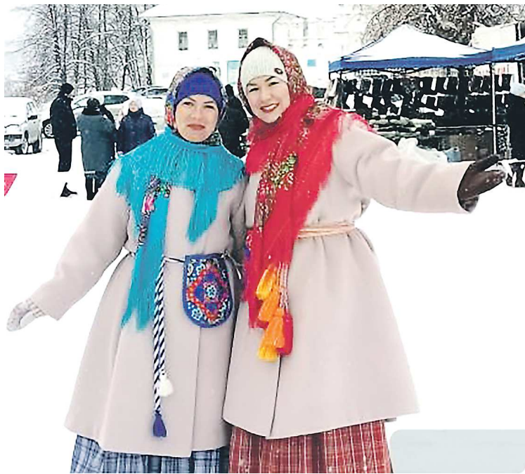
В новогодние каникулы «Ласточка» привозила туристов в духовную столицу каждый день

– Для духовной столицы, для прославления православ-