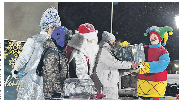
Гости новогодней елки также могли поучаствовать в розыгрыше и выиграть подарки

На открытии елки выступали местные артисты в костюмах веселых скоморохов и, конечно, главные герои праздника — Дед Мороз и Снегурочка. Между тем городок радовал горожан и гостей Красноуфимска не только все новогодние праздники, но и уже после каникул. Здесь также проводятся интересные программы для детей.