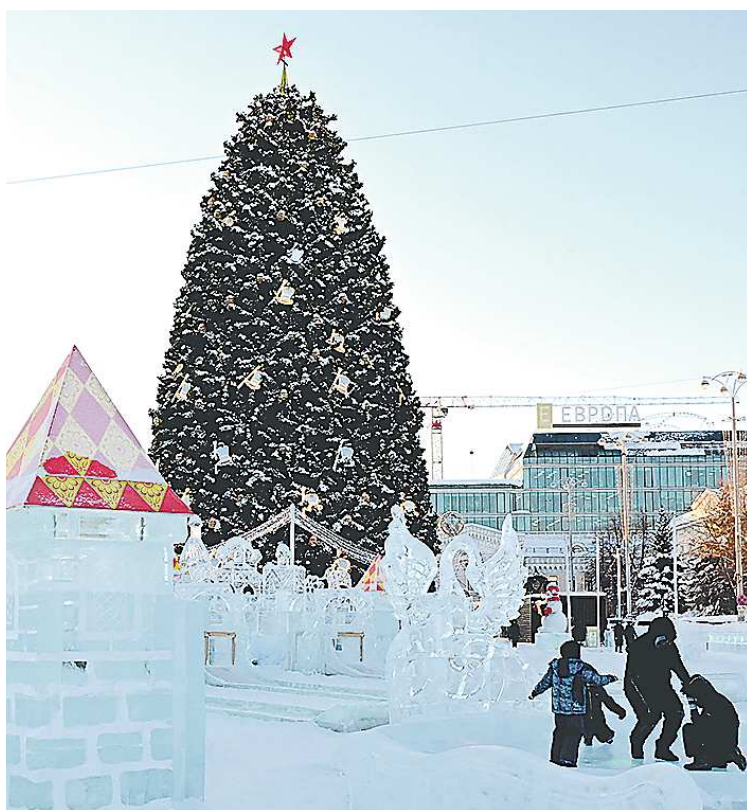
Как и в прошлые годы, в городке установили искусственную ель

Ледовый городок на площади 1905 года на зимних каникулах посетили более 26 тысяч жителей и гостей уральской столицы. Значительная часть из них провела в ледовом городке новогоднюю ночь. В народных гуляниях на главной площади Екатеринбурга приняли участие более 6 тысяч человек.