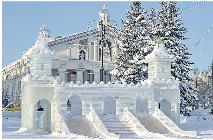
Для детей в городке установили горки разной высоты, лабиринт и ледяные чаши

Одним из самых масштабных ледовых городков стала площадка в Нижнем Тагиле. Здесь главный новогодний городок расположился на Театральной площади. Традиционно в ярком и веселом открытии приняло участие много взрослых и маленьких жителей города.