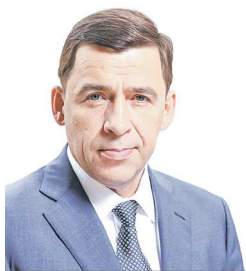
Губернатор Свердловской области