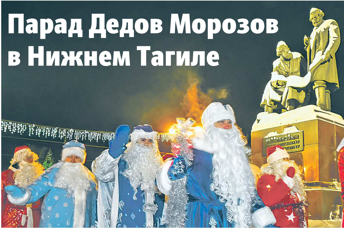
Больше 20 Дедов Морозов из учреждений культуры и образования города прошли по площади