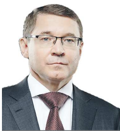
Полномочный представитель Президента России в Уральском федеральном округе

Уважаемые журналисты, сотрудники и ветераны средств массовой информации! Поздравляю с Днем российской печати! Желаю каждому из вас неустанного творческого поиска, неизменного читательского внимания, новых идей и сил для их реализации! Счастья и благополучия вам и вашим близким!