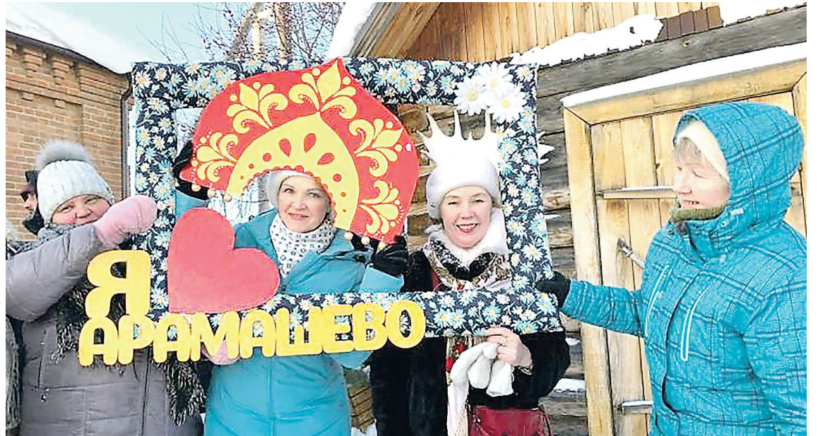
Популярными на празднике также были фотозоны