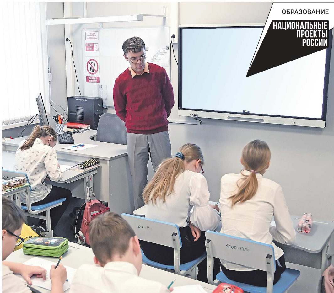
По программе «Земский учитель» педагоги трудоустраиваются в школы, отвечающие самым современным требованиям