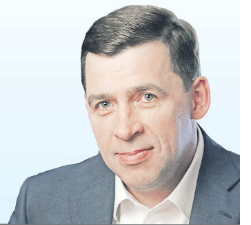
Евгений КУЙВАШЕВ, губернатор Свердловской области

“ Пусть новый 2024 год, объявленный в России Годом семьи, приумножит достигнутое, принесет в каждый дом душевное тепло, радость и счастье, подарит множество ярких моментов, праздников и встреч в кругу родных и дорогих людей, объединит всех нас для свершения добрых дел на благо Свердловской области.