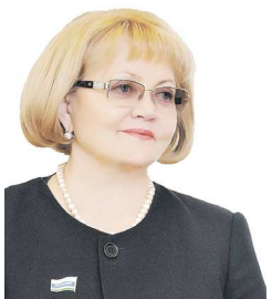
Председатель Законодательного Собрания Свердловской области