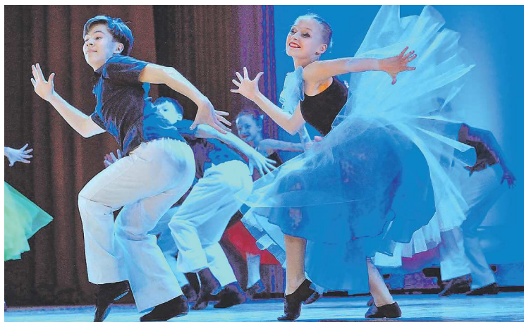
Несколько новых программ в юбилейном году представит ансамбль танца «Улыбка» («Классика на все времена», «Модный» концерт), главная из которых будет показана на сцене ККТ «Космос» 29 апреля