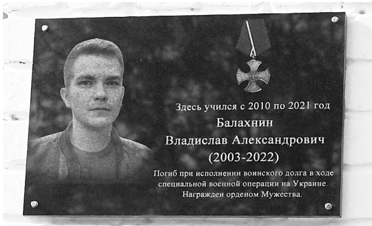
Мемориальная доска на здании школы №2

Летом того же года педагогический и ученический коллективы выступили с предложением изготовить и установить мемориальную доску на здании школы для увековечения памяти вы-