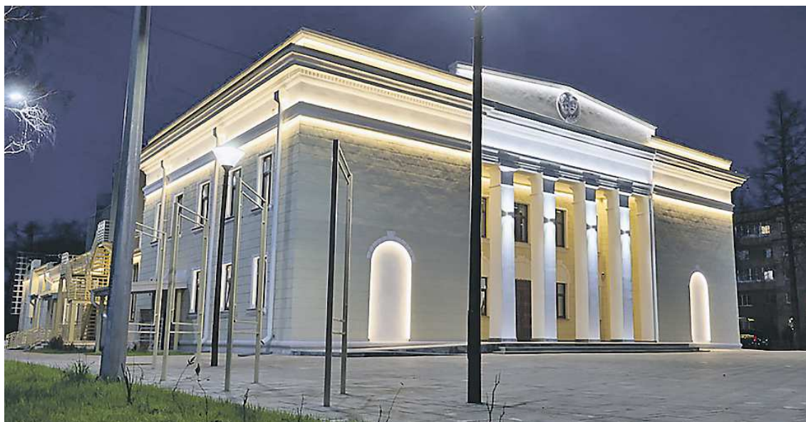
После реконструкции в Новом Молодежном театре появятся комфортные гримерные и современная акустическая система

ван лифт, рассчитанный на перевозку человека в инвалидном кресле с сопровождающим.