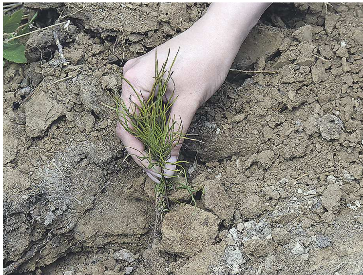
Ежегодно в Свердловской области высаживают десятки тысяч саженцев деревьев