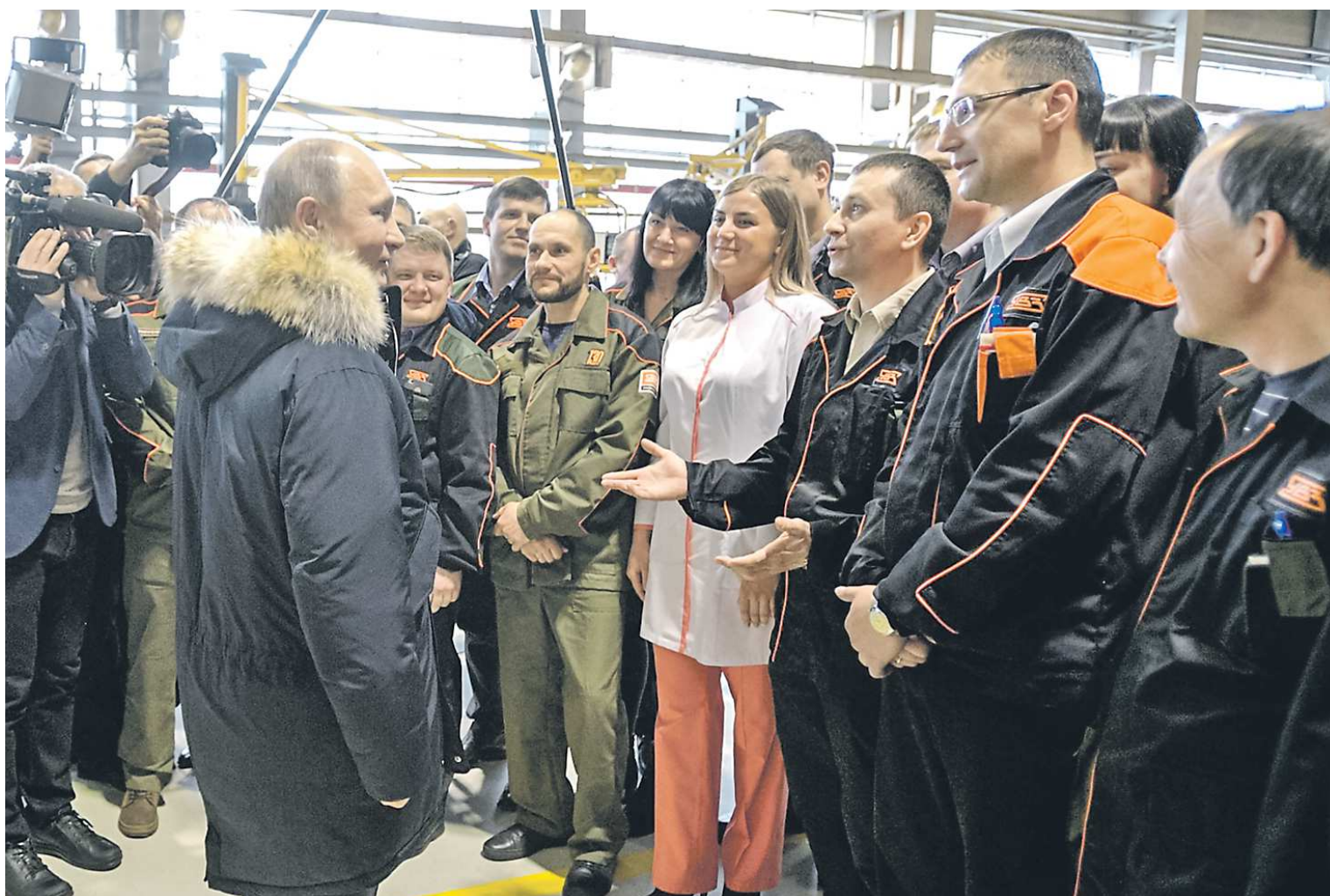
Владимир Путин общается с работниками Уралвагонзавода, 2018 год