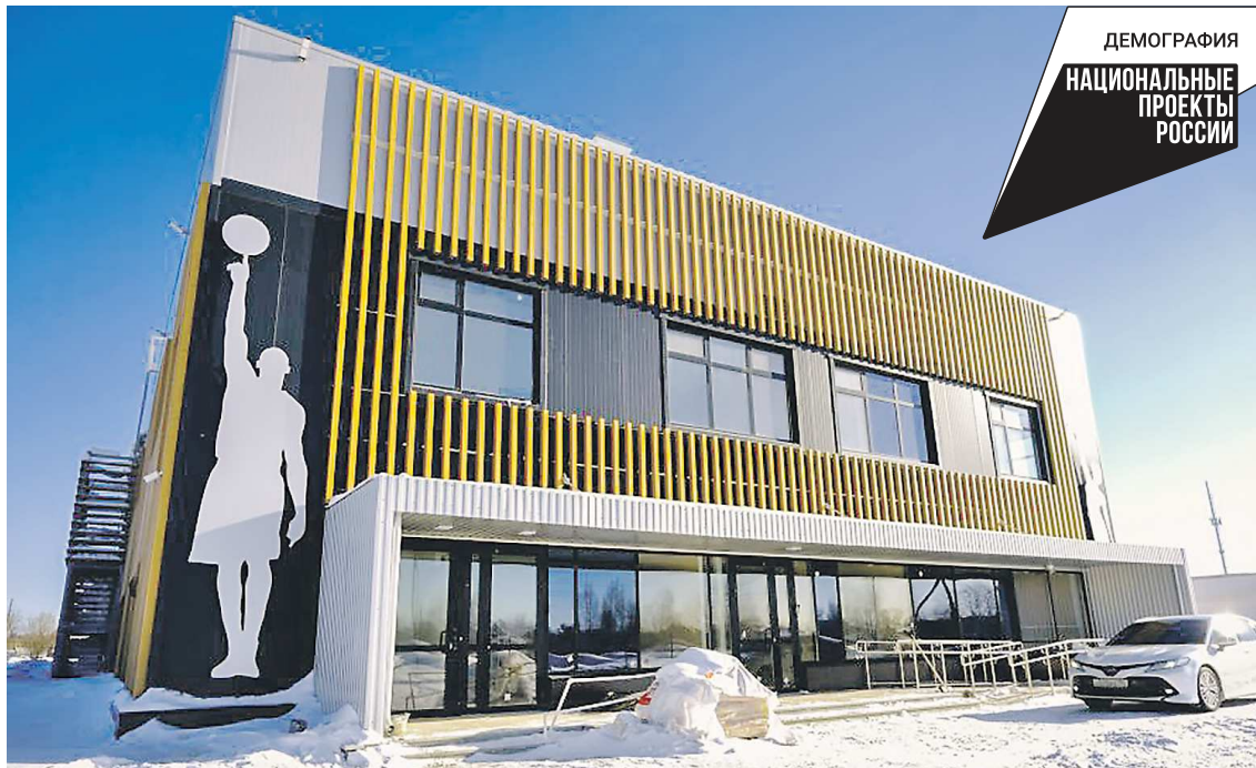
Физкультурно-оздоровительный комплекс – первый крупный спортивный объект в поселке Красный

В новом спортивном комплексе можно будет заниматься баскетболом, волейболом, бадминтоном. На первом этаже для этих видов спорта оборудован универсальный зал. На втором этаже размещены зал для занятий аэробикой с зеркальным покрытием и хореографическими станками, а также тренажерный зал и методический кабинет. Просторный холл позволит посетителям спорткомплекса проводить время между занятиями в комфортных условиях. Важно, что заниматься спортом в ФОКе смогут и люди с ограниченными возможностями: в здании запроектиро-