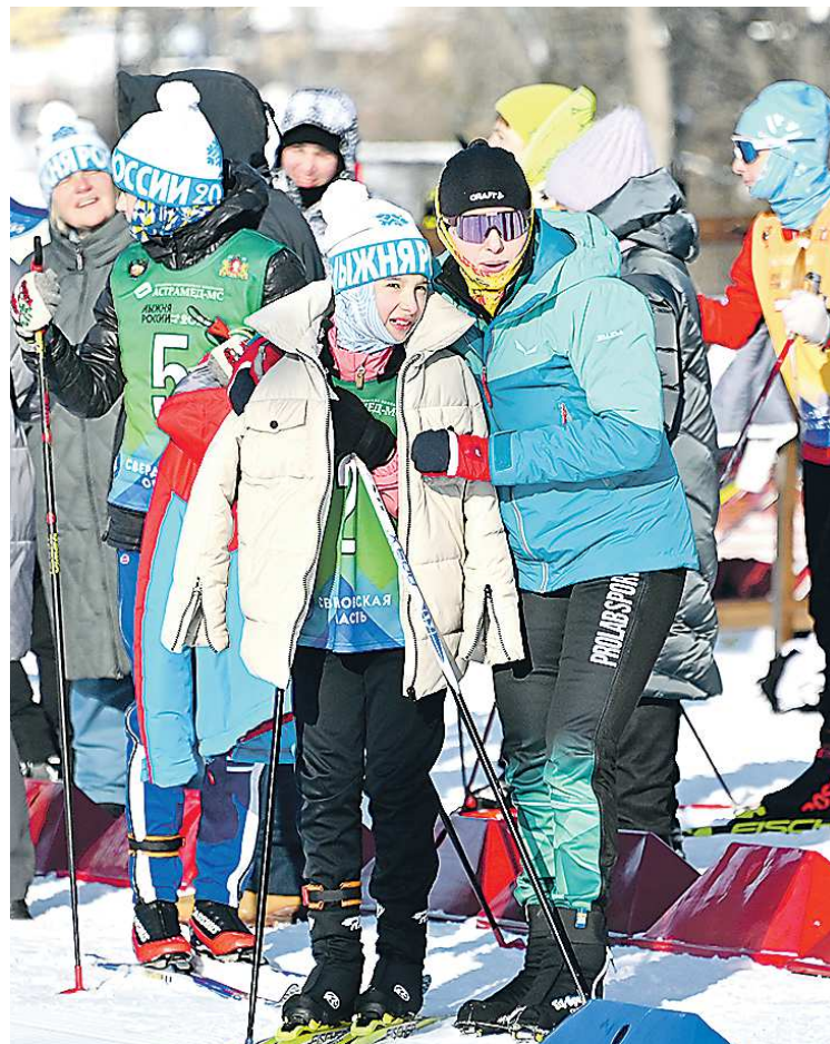
Во время «Семейной эстафеты» на трассе была хоть и спортивная, но при этом домашняя атмосфера

Несмотря на все напряжение, которое было на трассе, после окончания гонки все участники обнимались и поздравляли друг друга, поддерживали всех, кто только добирался до финиша. Обстановка была по-настоящему семейной.