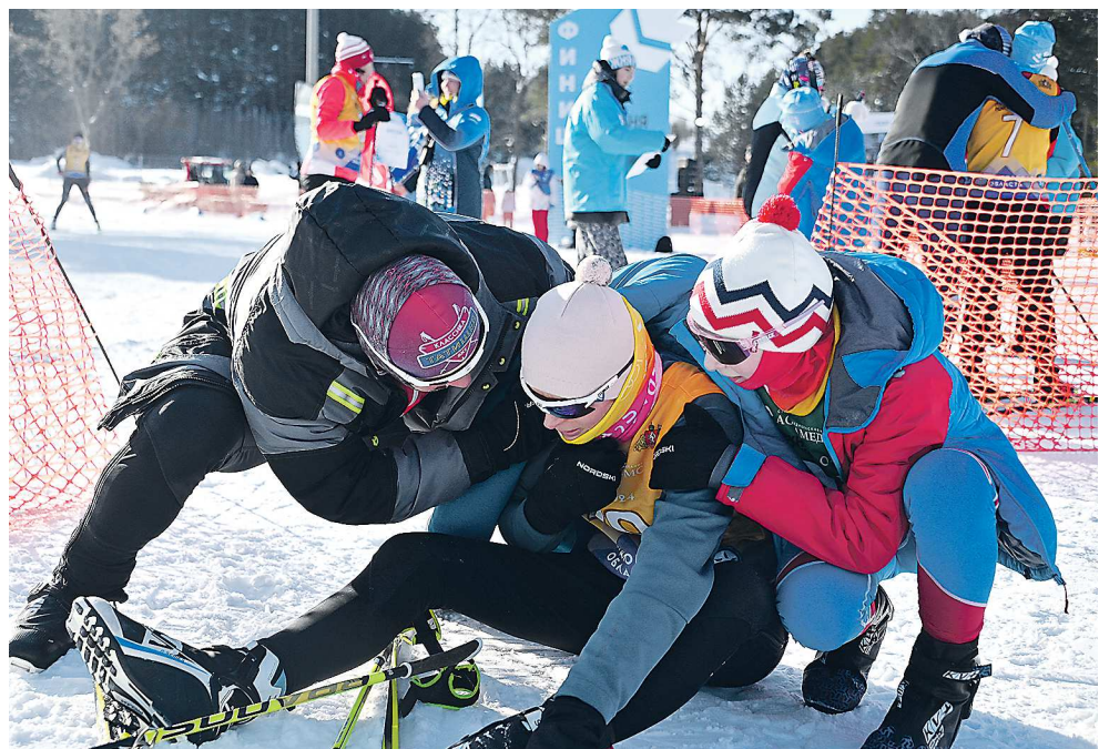
На финише «Семейной эстафеты» мамы, бежавшие последний этап, попадали в объятия своих родных