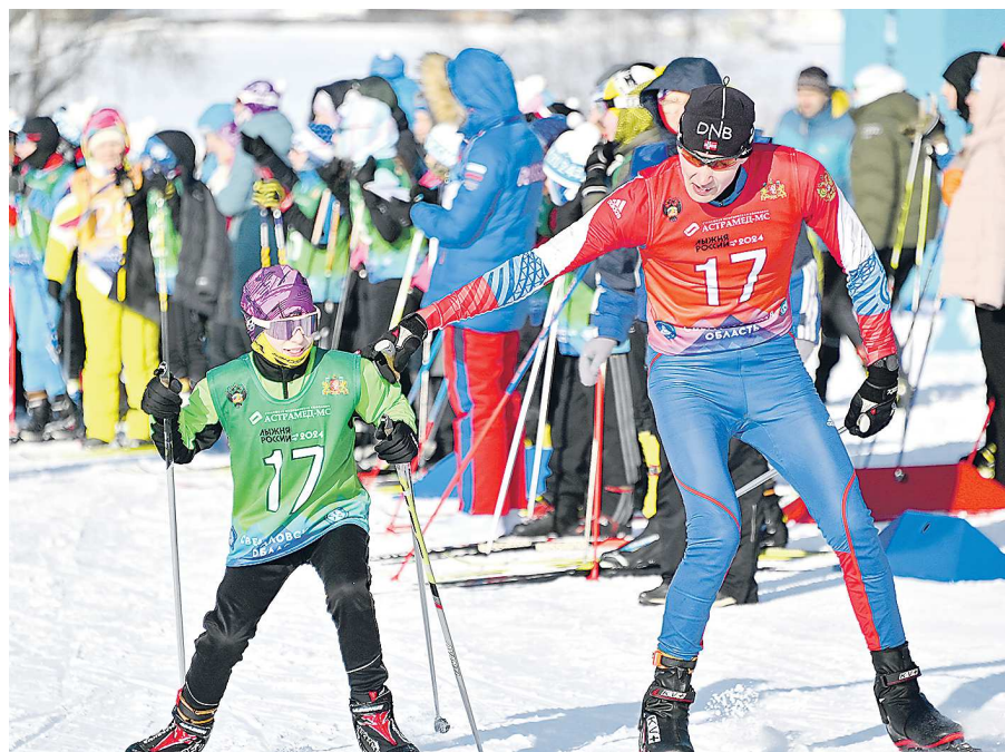
Передача эстафеты от отцов детям – один из самых милых моментов забега