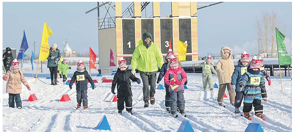
ПРЕСС-СЛУЖБА АДМИНИСТРАЦИИ НИЖНЕГО ТАГИЛА

Всего в 42-й традиционной массовой лыжной гонке «Лыжня России» на территории Качканарского городского округа участие приняло 2 630 человек: 632 воспитанника детских садов, 1 686 учеников образовательных учреждений города, 98 работников АО «ЕВРАЗ КГОК», 117 работников городских предприятий, 34 участника забега сильнейших, 21 семья в зачет спартакиады «Спортивная семья КГО». Все участники были награждены сладким призами.