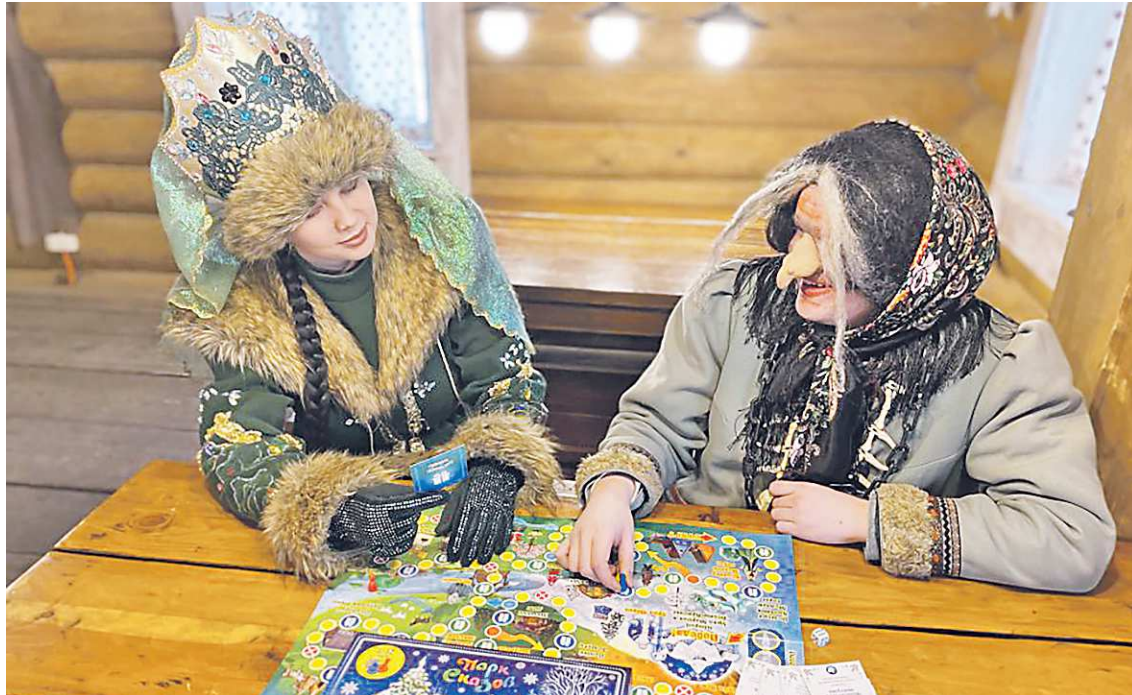
Среди персонажей игры – Хозяйка Медной горы, один из самых ярких образов в творчестве Бажова