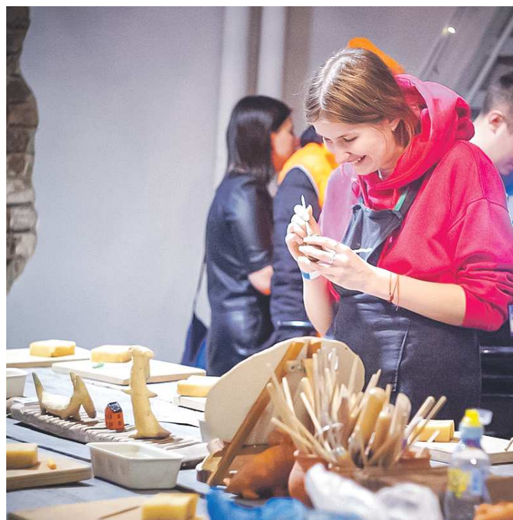
Мастер-классы в «Арт-резиденции» – это всегда заряд позитива