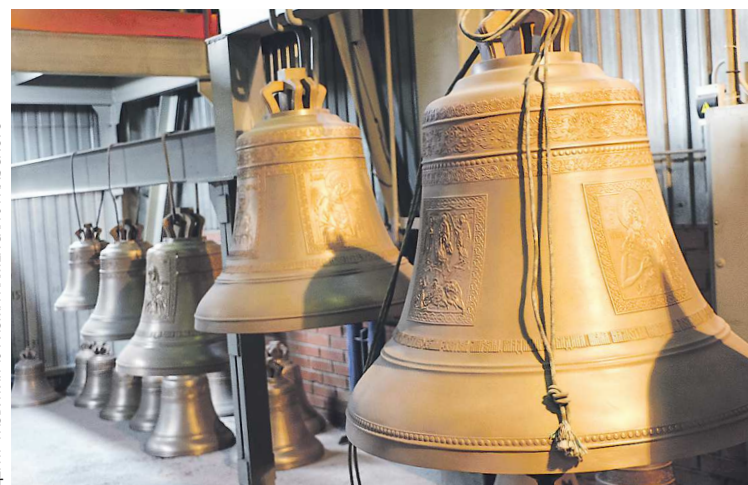
ЦЕНТР РАЗВИТИЯ ТУРИЗМА КАМЕНСКО-УРАЛЬСКОГО

Есть здесь и Угорское поселение с шаманом, форелевая ферма, мастерская средневековых ремесел, а в окрестностях Каменска можно покататься на упряжках с хаски в хаски-центре «У Каменных ворот» и пообщаться с козочками, кенгуру и верблюдом Жу-Жу на экоферме «Славянское гнездо».