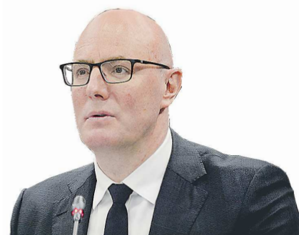
Дмитрий ЧЕРНЫШЕНКО, заместитель председателя Правительства РФ

“ В 2021 году Президентом было принято решение определить развитие туротрасли как одну из ключевых задач развития страны. Спрос на внутренний туризм не просто восстановился, но и превысил доковидный уровень. Мы сегодня говорим о росте на 20%, число поездок составило почти 80 миллионов. Это подтверждает правильность выбранной нами стратегии – стратегии наращивания предложения.