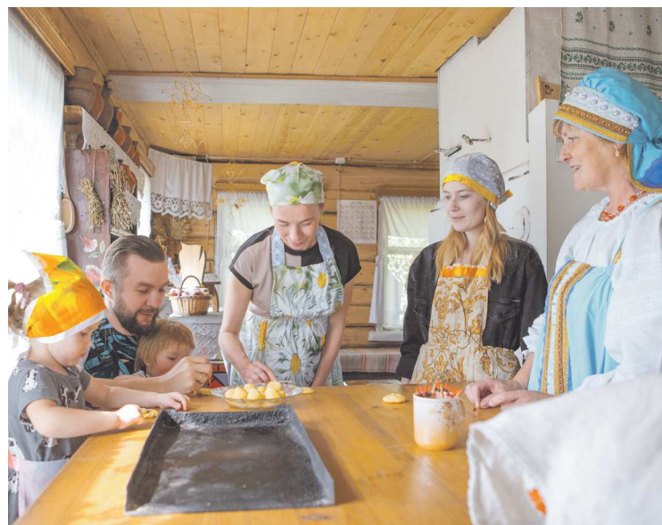
В музее «Русская изба» можно вылепить из теста печенье и плюшки и испечь их в печи