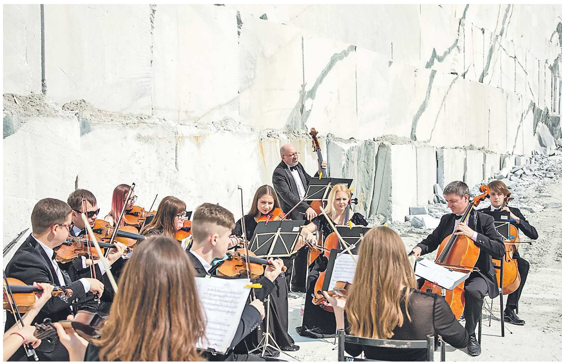
Ключевой объект одного из маршрутов – мраморный карьер, который ежегодно используется как «концертный зал»

В частности, туристический маршрут «Мраморная миля»