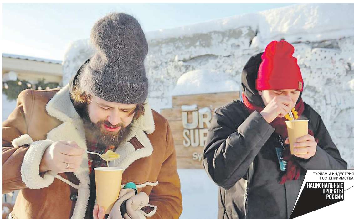
Оригинальный суп на свежем воздухе, как часть туристической культуры