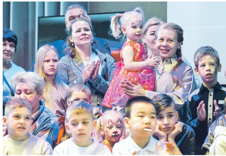
В Екатеринбург на церемонию открытия Года семьи приехали 600 семей со всей Свердловской области

23 января на Международной выставке-форуме «Россия» во время торжественной церемонии общероссийского старта Года семьи был зажжен огонь семейного очага «Сердце России». Он олицетворяет благополучие, спокойствие, тепло и счастье в доме. И вот огонь, который берет свое начало в Свято-Троицком монастыре Мурома – на родине святых Петра и Февронии – в Свердловской области.