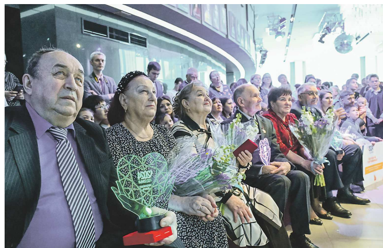
Знаком «Совет да любовь» награждаются супружеские пары, прожившие в браке не менее 50 лет, воспитавшие детей и внуков