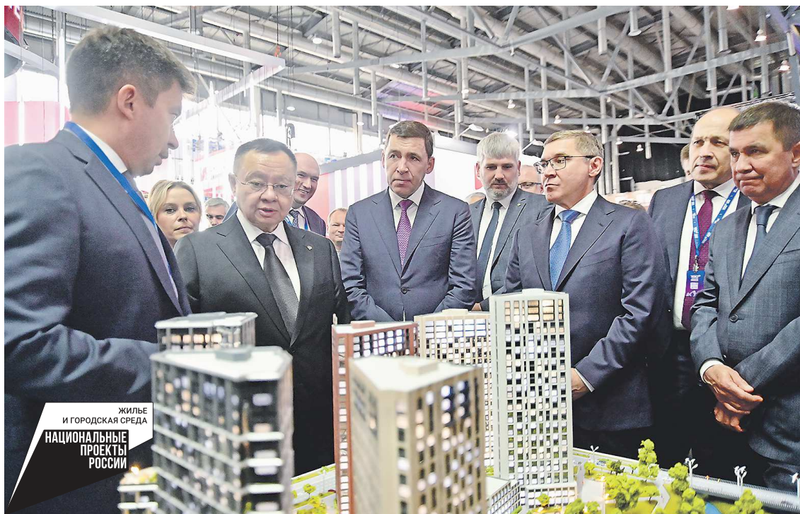
Вопросы реализации в Свердловской области нацпроекта «Жилье и городская среда» Евгений Куйвашев обсуждал с главой Минстроя России Иреком Файзуллиным на выставке 100+ TechnoBuild-2023

Согласно докладу заместителя губернатора Свердловской