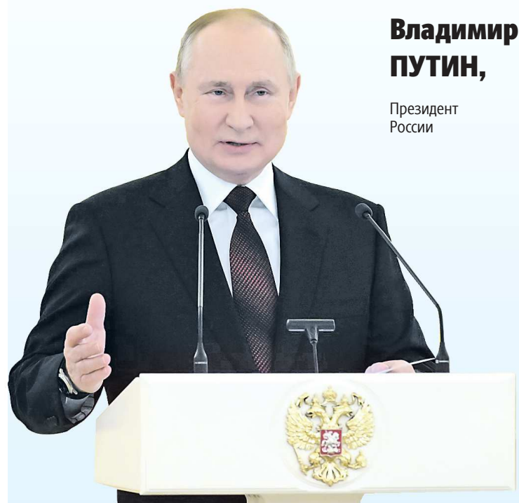
Владимир ПУТИН, Президент России

« Главное предназначение семьи – это рождение детей, продолжение рода, а значит, продолжение нашего народа, нашей многовековой истории. В семье укоренены наша культура, идентичность, национальный характер. Семья учит, воспитывает, передает традиции, знания, в том числе и профессиональный опыт. Во всех российских регионах есть известные династии: военнослужащие, инженеры, сталевары, врачи, учителя, деятели культуры. Семьи, люди разных национальностей, которые хранят верность избранному призванию и гордятся своим делом.