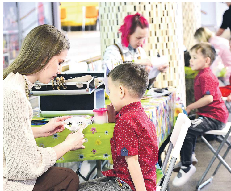
До начала официальной части детям предложены разного рода активности – аквагрим, игры, викторины, мастер-классы

Прибытие огня на Средний Урал ознаменовало открытие первого Семейного МФЦ. Конечным местом нахождения лампы выбран храм, являющийся одним из символов Екатеринбурга. На открытии Года семьи в Свердловской области огонь передается в Храм-памятник на Крови.