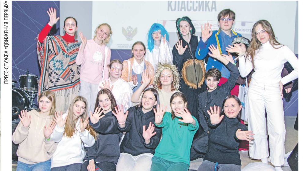
Участники «Школьной классики»