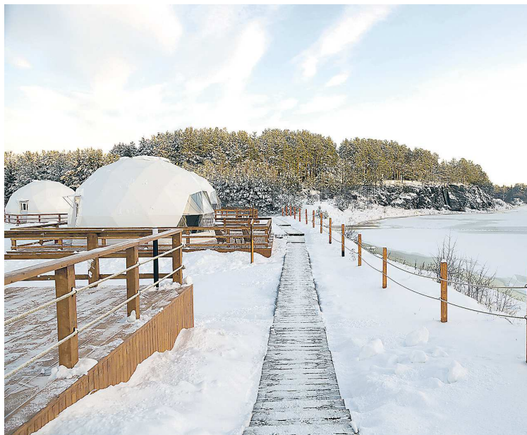
В обновленном загородном клубе появились геокуполы с панорамным видом на знаменитый Кликун-камень

– Когда приехали первые гости, на вокзале температура была около минус 40 градусов, но ничего, людей это не остановило. Некоторые из приехавших в первый раз побывали в Верхотурье. Всех гостей водили в музей, мужской монастырь, в женский, обедом накормили. Заканчивался маршрут в доме ремесел, он у нас работает уже 6 лет, отсюда тоже без подарков не уехали, здесь можно приобрести различную сувенирную продукцию. Провели мастер-классы, детский коллектив подготовил небольшую творческую про-