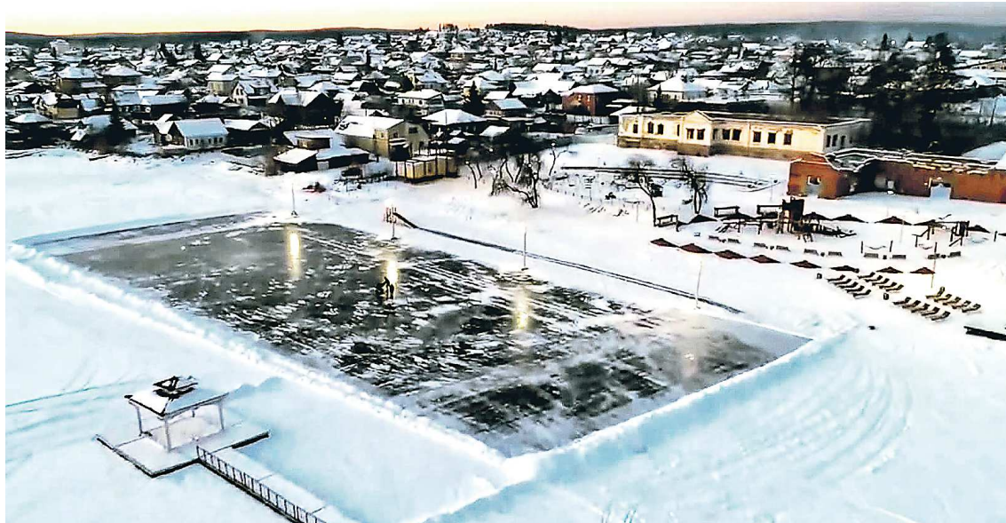
Самый большой каток на Урале протяженностью в 7 км вновь открылся в Сысерти

Несмотря на морозную погоду, весомый поток туристов от-