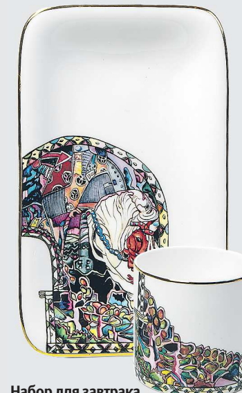
Набор для завтрака, расписанный по мотивам камня Михаила Врубеля