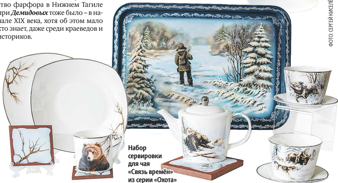
Набор сервировки для чая «Связь времён» из серии «Охота»