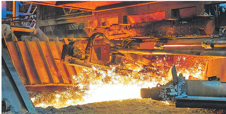
Льющийся металл в жерле современной домны и прогулка по огромному производству оставят неизгладимые впечатления у гостей маршрута

В 2022 году «Демидовский маршрут» стал первым национальным маршрутом в Свердловской области. Он проходит по территории трех муниципаль-