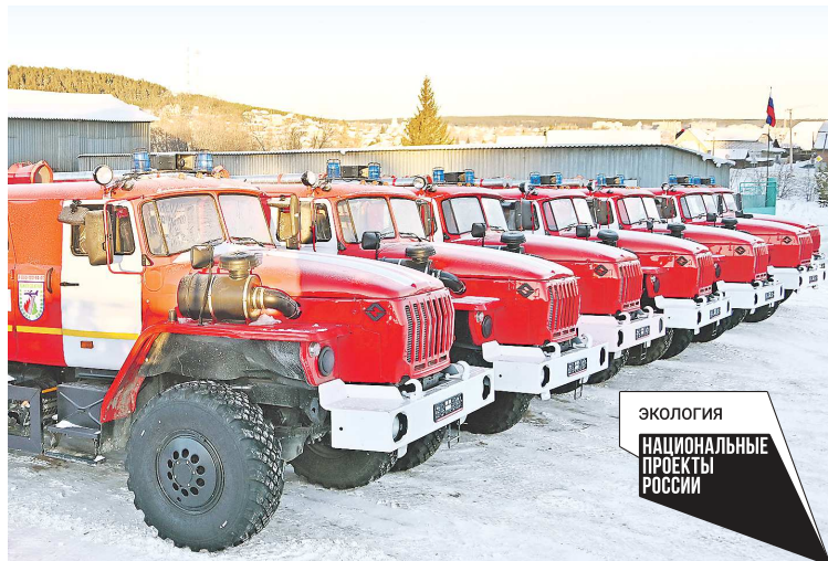
Среди новой техники – 10 пожарных машин «Урал»