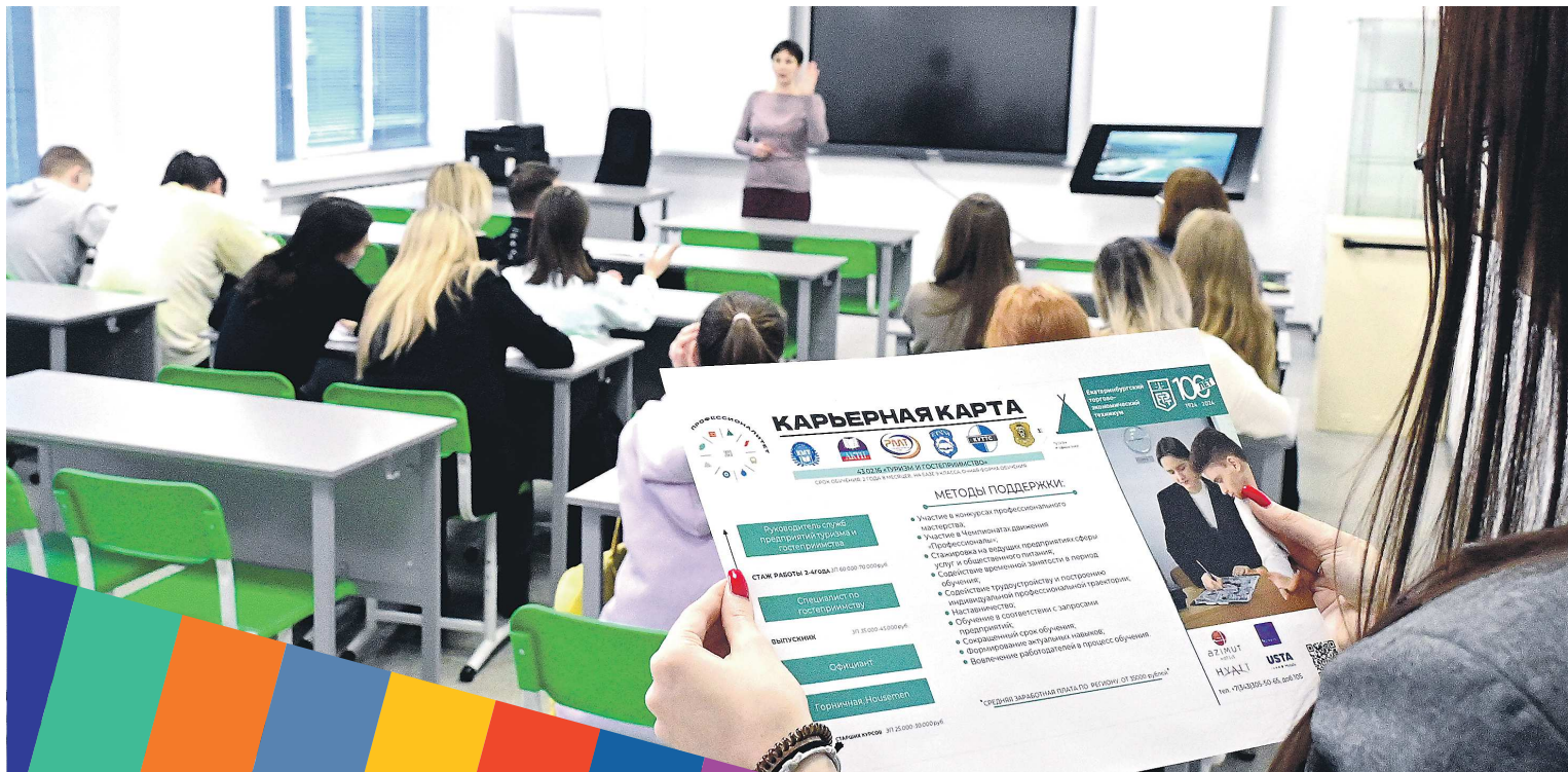
В Екатеринбургском торгово-экономическом техникуме уже разработаны карьерные карты по специальностям

Важным элементом программы «Профессионалитет»