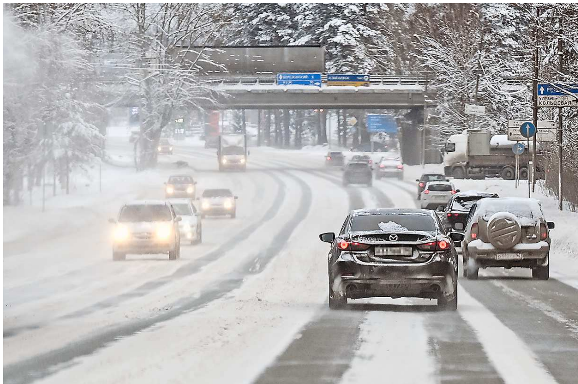
Средства на ремонт дорог получают Ирбит, Артемовский, Верхняя Пышма и другие муниципалитеты

Так, Артемовскому выделены 72,9 миллиона рублей на реконструкцию улицы Энергетиков. Верхняя Пышма получит почти 110 миллионов на строительство улиц в районе Северном. В бюджет Верхней Туры поступят 251,2 миллиона рублей на продолжение реконструкции