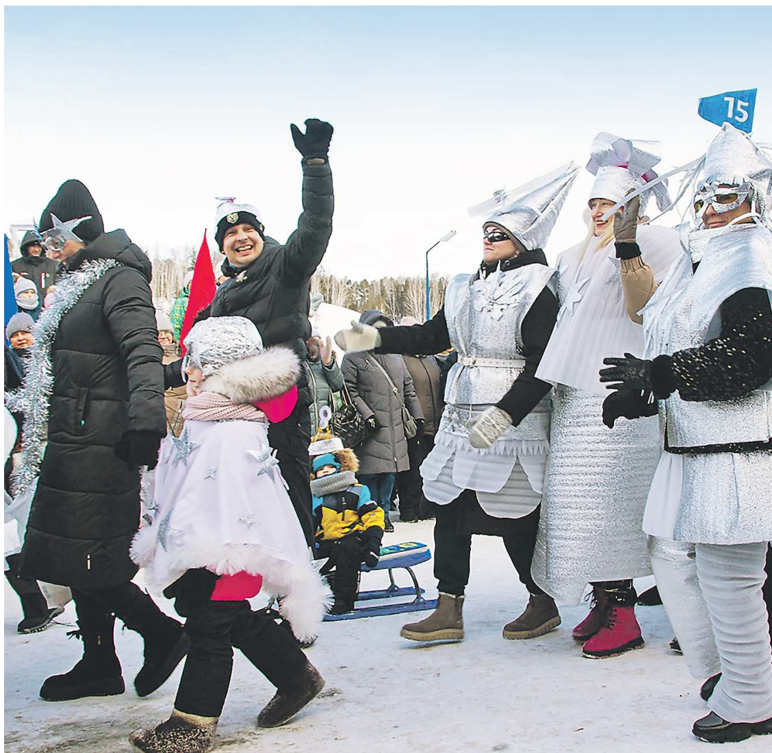
Парад «Снегопланетян» стал главной фишкой праздника