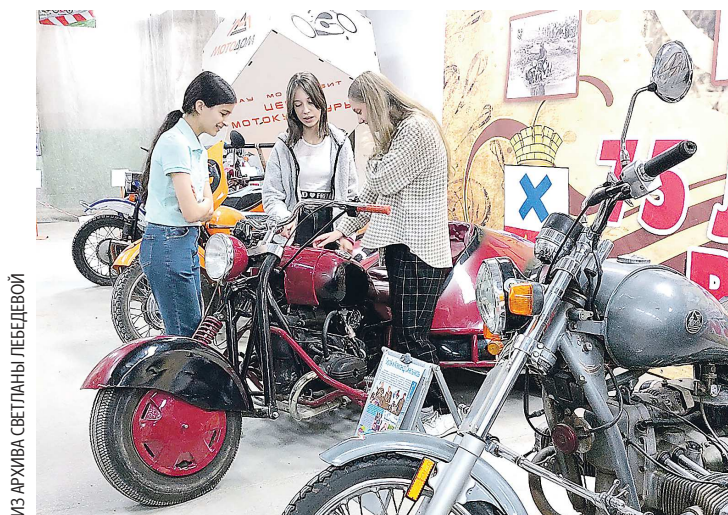
Медиадесант в Ирбите, в музее «МОТОДОМ»

СОЦИАЛЬНЫЕ СЕТИ ЗАГОРОДНОГО КЛУБА «ЯБЛОНЕВЫЙ САД»