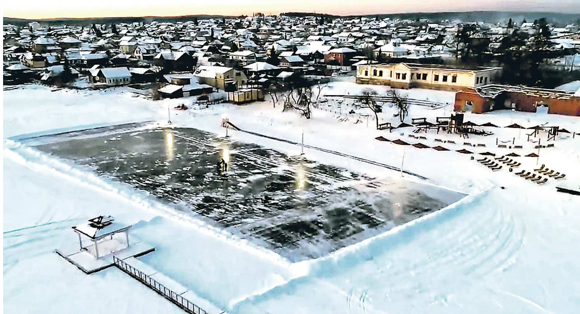
Самый большой каток на Урале протяженностью в 7 км вновь открылся в Сысерти

Ирбит посетили более двух тысяч туристов. В 2023 году муниципалитет включили в Ассоциацию малых туристических городов России. Ранее губернатор Евгений Куйвашев анонсировал масштабную региональную программу «Ирбит – город-музей», которая предполагает всестороннее развитие старинного уральского города и расположенных здесь объектов культурного наследия, а также улучшение социально-экономических показателей.