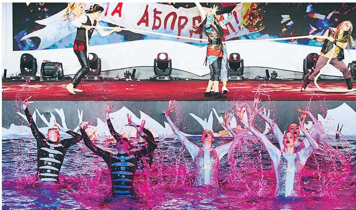
Действие постановки будет проходить в воде, на земле и в воздухе