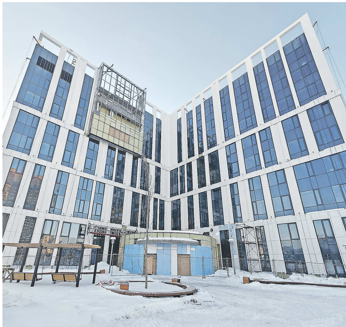
Вместе с поликлиникой в здании будут работать женская консультация и травмпункт