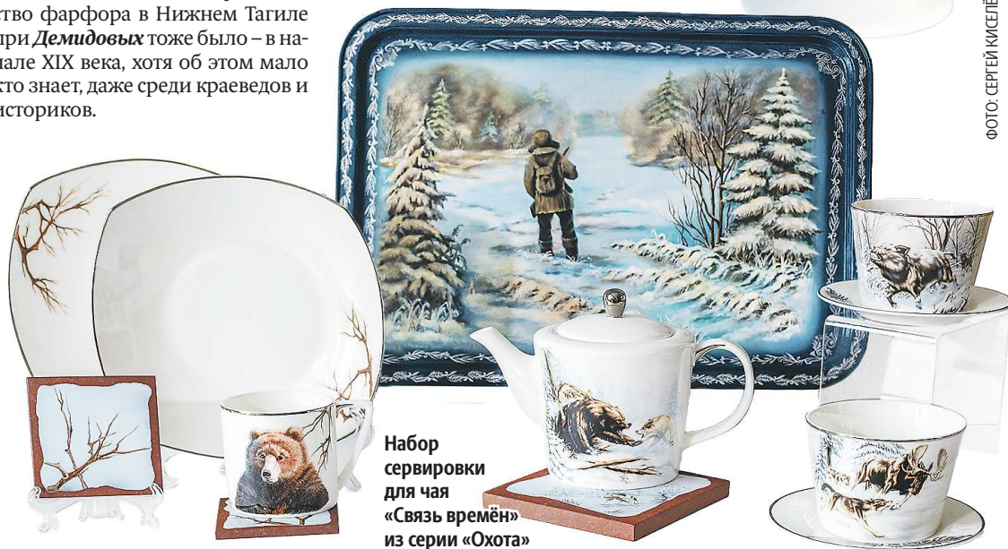
Набор сервировки для чая «Связь времён» из серии «Охота»

– Да, мы делали с Нижнетагильским музеем изобразительных искусств работы по мотивам художника-авангардиста Павла Голубятникова. Тем более что Нижнетагильский музей изобразительных искусств – единственный в мире, где собрана полная коллекция художника. И она, кстати, очень часто путешествует по миру, Голубятников – современник Малевича, Кандинского, Шагалу, учился вместе с ними – это одна школа. Получился интересный проект. Что касается музеев Екатеринбурга, то совместного опыта еще не было, но мы будем счастливы посотрудничать.