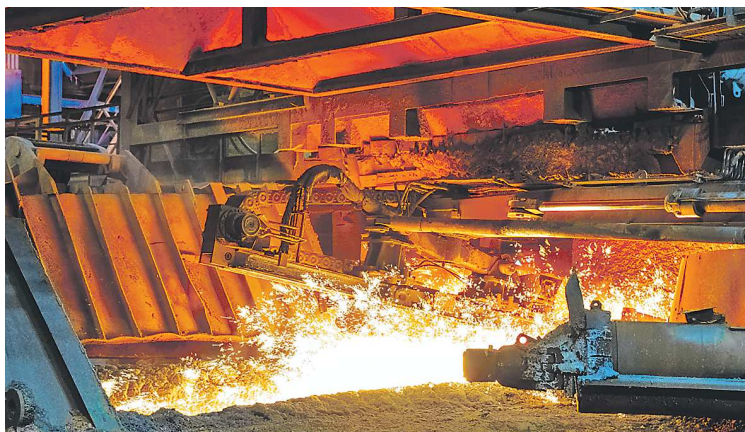
Льющийся металл в жерле современной домны и прогулка по огромному производству оставят неизгладимые впечатления у гостей маршрута

В 2022 году «Демидовский маршрут» стал первым национальным маршрутом в Свердловской области. Он проходит по территории трех муниципальных образований: Екатеринбург, Невьянский городской округ, а также Нижний Тагил. Протяженность маршрута составляет более 300 км. Именно здесь началось строительство металлургических заводов по изготовлению