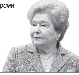
Наина Иосифовна ЕЛЬЦИНА, вдова первого президента России Бориса Николаевича Ельцина