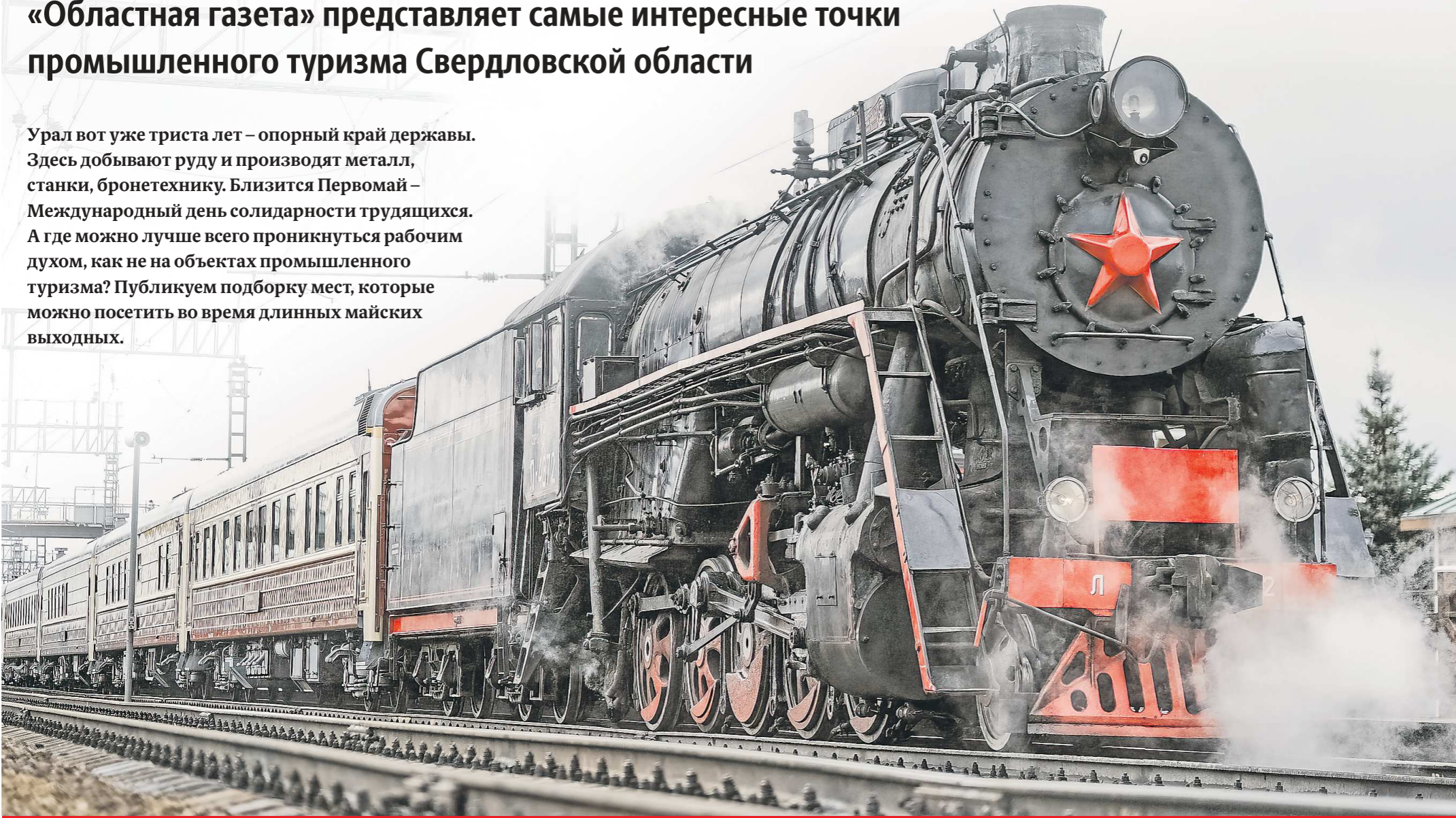
Верхняя Пышма | ул. Александра Козицына, 2

Урал вот уже триста лет – опорный край державы. Здесь добывают руду и производят металл, станки, бронетехнику. Ближится Первомай – Международный день солидарности трудящихся. А где можно лучше всего проникнуться рабочим духом, как не на объектах промышленного туризма? Публикуем подборку мест, которые можно посетить во время длинных майских выходных.