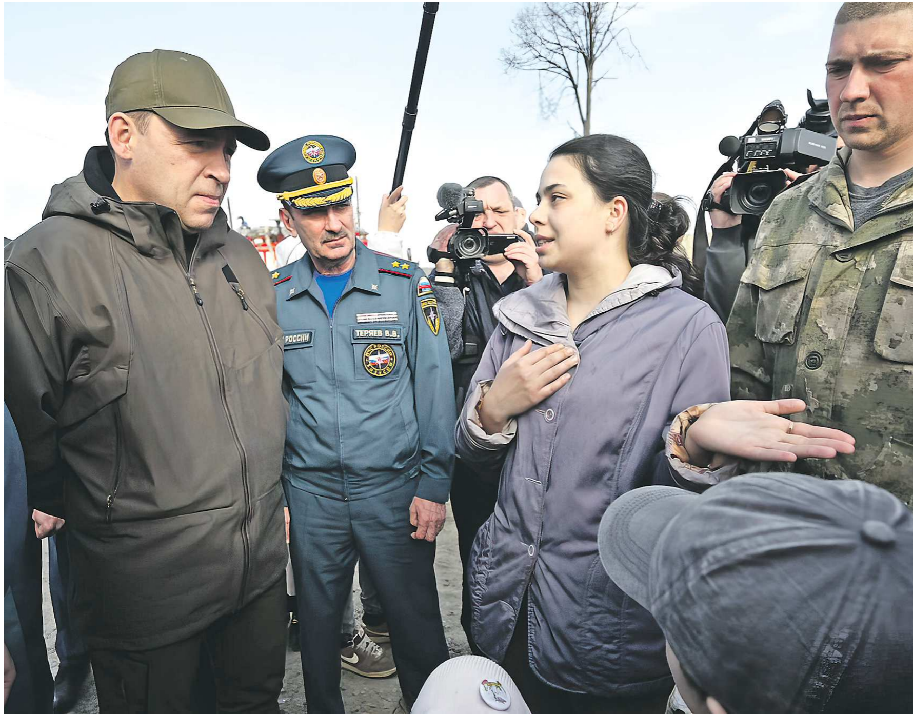
Вчерашний день Евгений Куйвашев начал с визита в Сосьву, изучения и решения проблем пострадавших после пожара жителей поселка

Губернатор Евгений КУЙВАШЕВ вчера с раннего утра работал в Сосьве, где накануне произошел крупный пожар. Вместе с прибывшим в регион главой МЧС Александром КУРЕНКОВЫМ он провел координационное совещание по вопросам ликвидации его последствий. Глава региона принял ряд оперативных решений, связанных с помощью погорельцам, о которых позже рассказал на встрече с жителями поселка, чьи дома сгорели при пожаре. В их числе – восстановление в течение одного сезона жилого фонда поселка, выделение на выплаты погорельцам 95 миллионов рублей из бюджета области, адресная помощь всем семьям с детьми. Все решения штаба распространяются и на другие пострадавшие от огня населенные пункты, подчеркнул губернатор. После встречи с жителями Евгений Куйвашев и Александр Куренков доложили о ситуации в Сосьве Президенту России Владимиру ПУТИНУ.