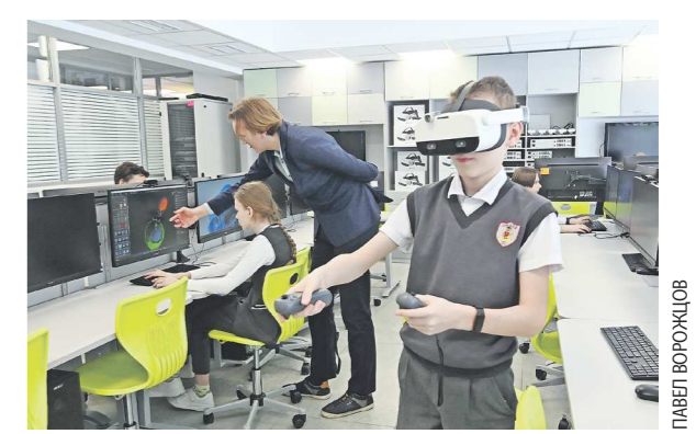
Проект «Билет в будущее» реализуется в рамках нацпроекта «Образование»

Старт российской профориентационной кампании был дан в Екатеринбурге месяц назад. В объявленный Президентом России Владимиром Путиным Год педагога и наставника в столице Среднего Урала проводился фестиваль «Билет в будущее». Участие в нем приняли губернатор Свердловской области Евгений Куйвашев и министр просвещения России Сергей Кравцов . Министром было анонсировано внедрение в школьную программу профориентационного минимума по семи направлениям: профильные классы, урочная деятельность, внеурочная деятельность, организация воспитательной работы, дополнительное образование, профессиональное обучение, взаимодействие с родителями или законными представителями учащихся.