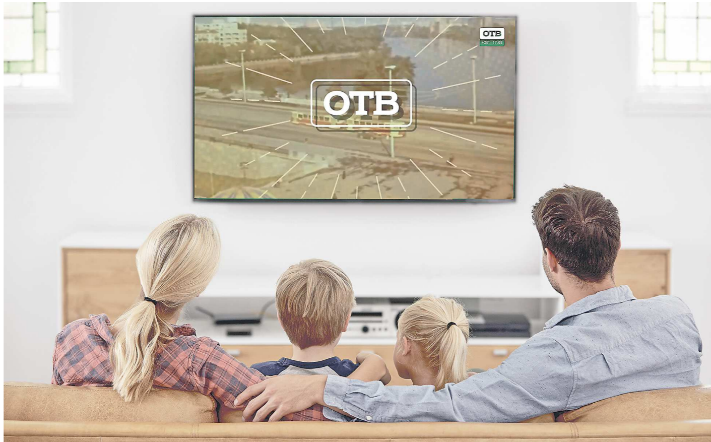
Эксперты считают, что телезрители Среднего Урала хорошо разбираются в технологиях и готовы принимать новшества

Суть проекта РТРС в том, что к 20 каналам цифрового эфирного телевидения добавляется еще один – под цифрой «999». Переключаясь на него, зритель видит статичную картинку, которая через пару секунд меняется на меню платформы «РТРС.ПЛЮС». Далее, выбрав вкладку «Местное ТВ», можно смотреть передачи не только главного регионального канала «Областного телевидения» (ОТВ), но и муниципальных телеканалов, среди которых «Телекон» и «Талил ТВ» (Нижний Тагил), «РИМ» (Каменск-Уральский), «Инок ТВ» (Талица), «11 канал» (Полевской), «ПТВ» (Первоуральск), «НТС Ирбит», «Родники Ирбитские» (Ирбитский район), «Новоуральская вещательная компания» (Новоуральск), «Канал С» (Серов), «Богданович ТВ» (Богданович). Зайти на платформу «РТРС.ПЛЮС» можно не только на телевизорах с функцией HbbTV, (стандарт, объединяющий возможности Интернета и телевидения), но и на мобильных устройствах. Для этого нужно просто скачать соответствующее приложение.