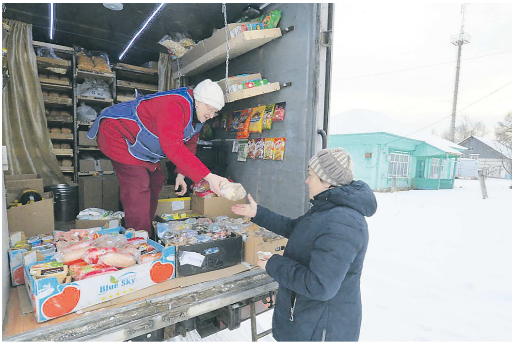
Субсидии получают предприниматели, готовые вести торговлю в малонаселенных и отдаленных территориях области