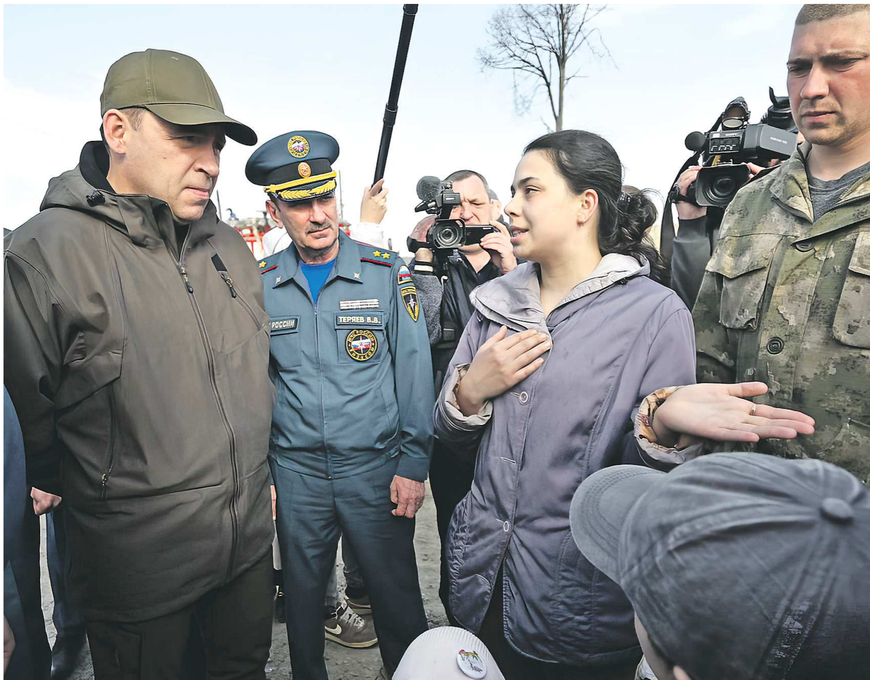
Вчерашний день Евгений Куйвашев начал с визита в Сосьву, изучения и решения проблем пострадавших после пожара жителей поселка

Губернатор Евгений КУЙВАШЕВ вчера с раннего утра работал в Сосьве, где накануне произошел крупный пожар. Вместе с прибывшим в регион главой МЧС Александром КУРЕНКОВЫМ он провел координационное совещание по вопросам ликвидации его последствий. Глава региона принял ряд оперативных решений, связанных с помощью погорельцам, о которых позже рассказал на встрече с жителями поселка, чьи дома сгорели при пожаре. В их числе – восстановление в течение одного сезона жилого фонда поселка, выделение на выплаты погорельцам 95 миллионов рублей из бюджета области, адресная помощь всем семьям с детьми. Все решения штаба распространяются и на другие пострадавшие от огня населенные пункты, подчеркнул губернатор. После встречи с жителями Евгений Куйвашев и Александр Куренков доложили о ситуации в Сосьве Президенту России Владимиру ПУТИНУ.