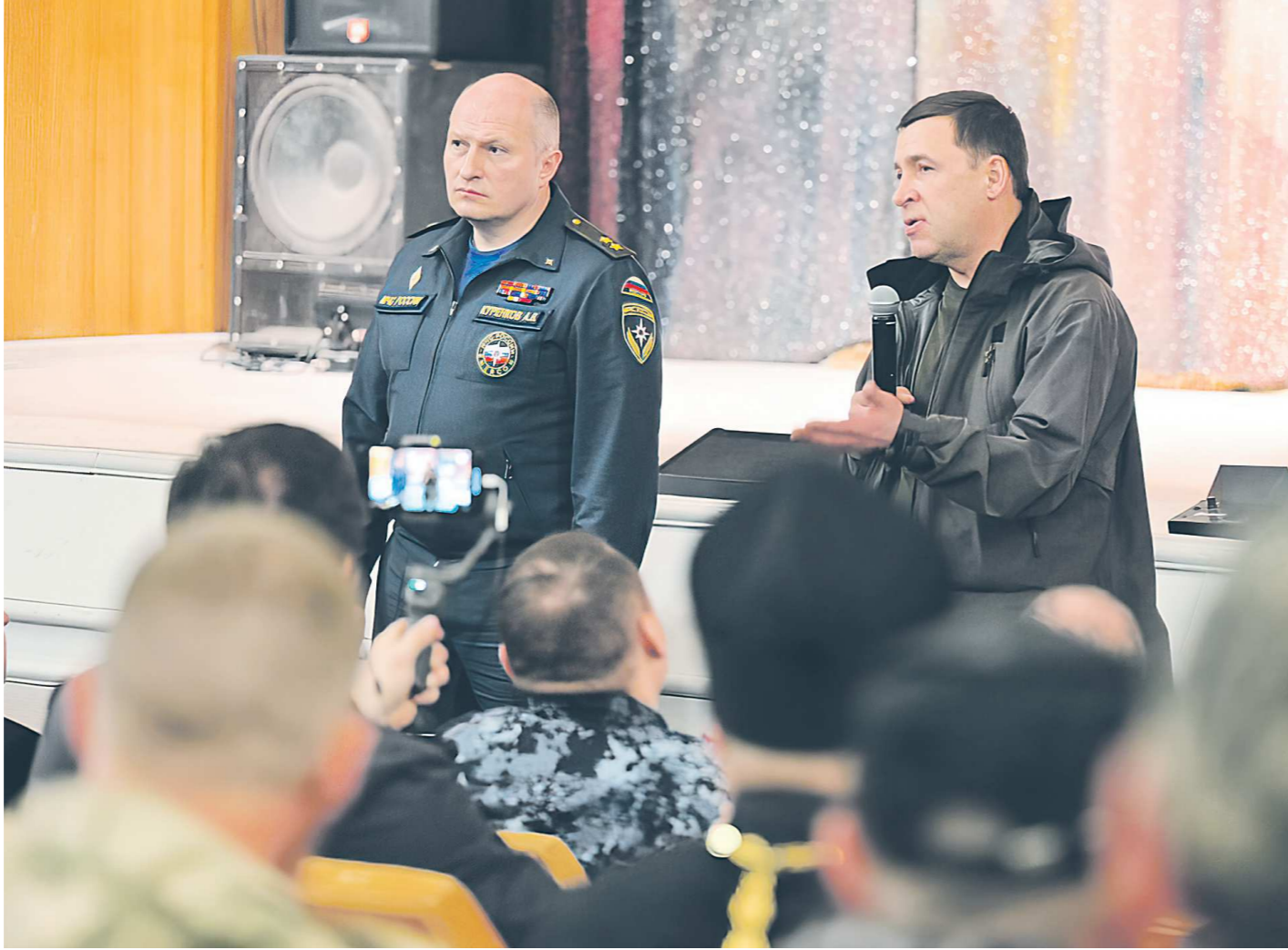
Участники встречи отмечают: на все их просьбы и пожелания Евгений Куйвашев откликнулся оперативно

Среди первоочередных задач Евгений Куйвашев обо-