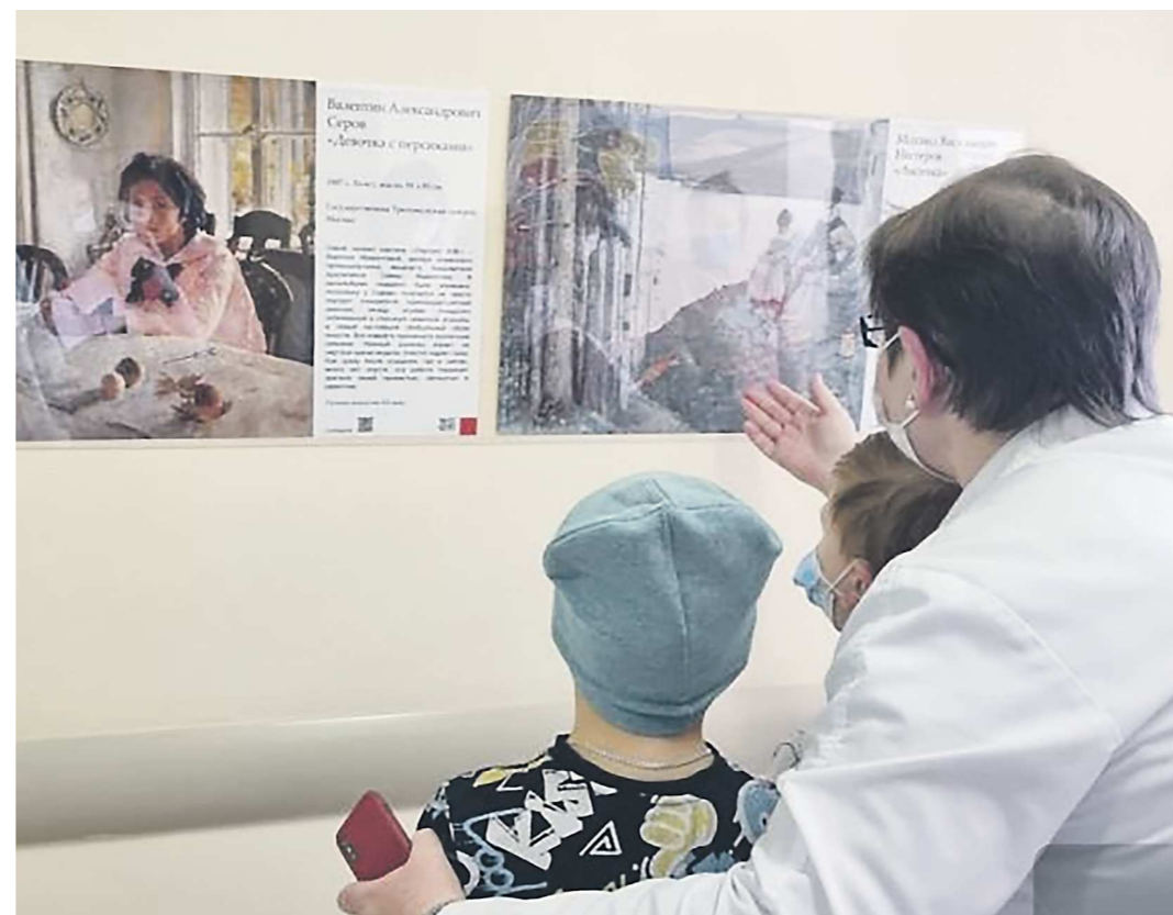
Благодаря проекту «Ареал культуры» больничный коридор превратился в интерактивную галерею

ДЕПАРТАМЕНТ ИНФОРМАЦИОННОЙ ПОЛИТИКИ СВЕРДЛОВСКОЙ ОБЛАСТИ