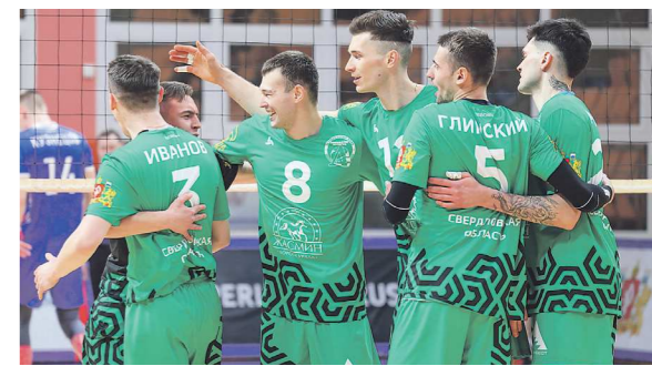
В этом сезоне «Локомотив-Изумруд» и «Тюмень» сыграли уже 7 матчей. Уралцы выиграли 4, сибиряки – 3