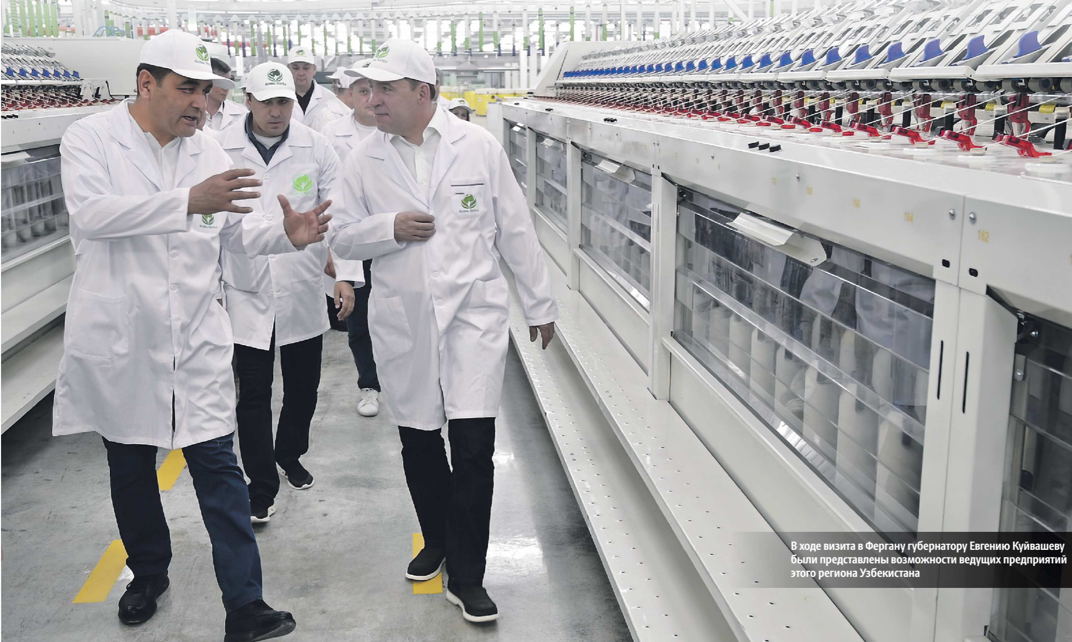
В ходе визита в Фергану губернатору Евгению Куйвашеву были представлены возможности ведущих предприятий этого региона Узбекистана

Подписано Соглашение о сотрудничестве между Свердловской и Ферганской областями