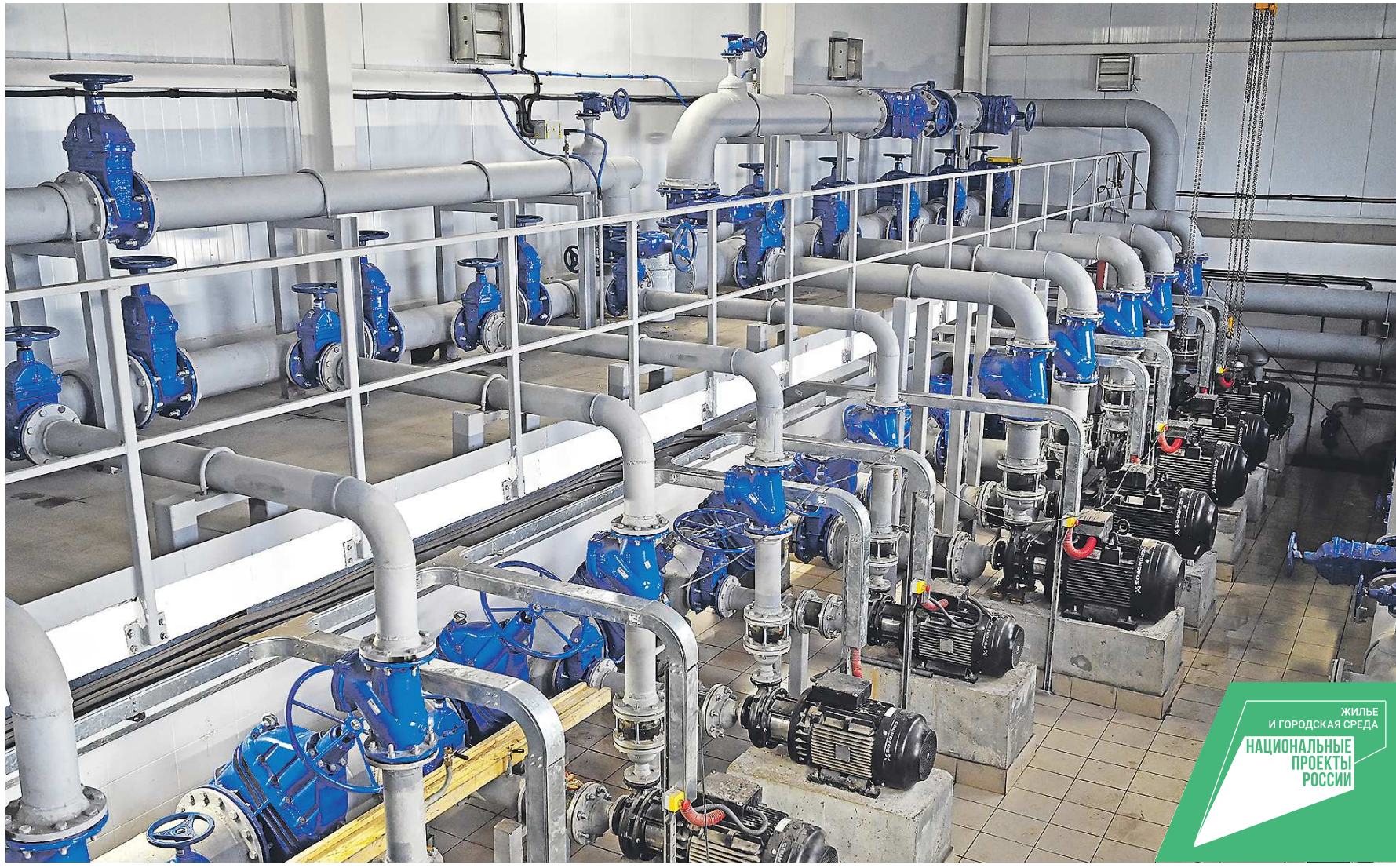
Новая станция обеспечит чистой водой более 200 тысяч тагилчан

«В рамках федерального проекта «Чистая вода» Нижний Тагил получит субсидию на строительство инженерных коммуникаций и станции водоподготовки «Южная» в поселке Черноисточинск. За два года на мероприятия из федерального и областного бюджетов будет выделено свыше 950 миллионов рублей», – сообщил Евгений Куйвашев на прошедшем в минувший четверг заседании правительства.