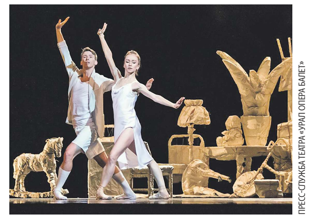
Сцена из первого акта балета «L.A.D.» – «Три тихие пьесы» на музыку к кинофильму «Подмосковные вечера»

Отметим, что спектакли «L.A.D.» и «Маленькая серенада» также претендуют на главную театральную премию страны «Золотая маска». Церемония вручения наград состоится сегодня в Москве.