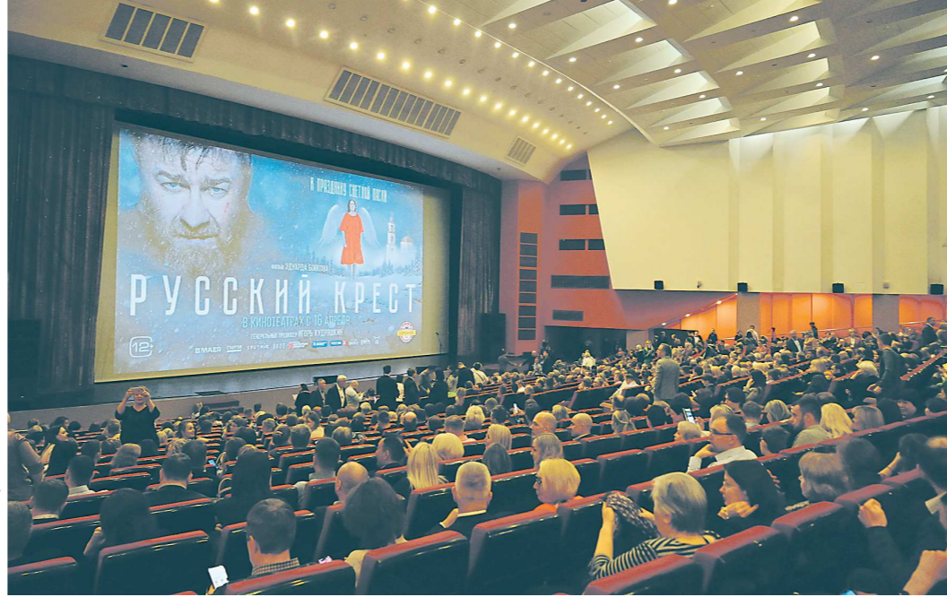
Создатели картины отмечают, что она будет интересна самой широкой аудитории — от старшего поколения до молодежи

В общем, губят русский народ (на экране телевизора — Борис Ельцин), губит себя главный герой, спившийся одурочкой сторож. Но однажды было ему видение: Георгий Победоносец поражает змея. Потрясенный Иван понимает: он должен восстановить разрушенную церковь в своем селе. Бросает пить, сколачивает большой дубовый крест, зваливает его на спину и отправляется собирать деньги на восстановление храма... Повествование идет в рифму, де-