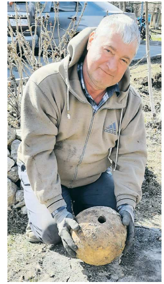
ПОРТАЛ «РЕАЛЬНЫЙ КАМЕНСК-УРАЛЬСКИЙ»

Исторический артиллерийский снаряд залегал на глубине полутора метров и был поднят ковшом экскаватора. Как сообщает портал «Реальный Каменск-Уральский», вес чугунной находки составляет около 40 кг. Местные сварщики взяли ядро под охрану, чтобы его не сдали на металлолом. Они планируют передать снаряд в городской краеведческий музей в качестве экспоната. Есть версия, что пушечное ядро было отпущено на Каменском чугунолитейном заводе в конце XVII – начале XVIII веков.