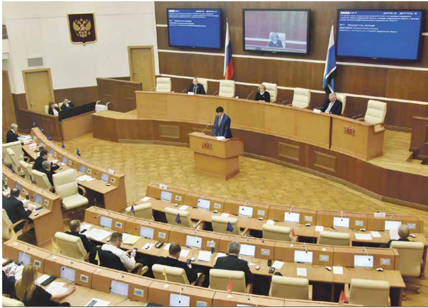
ЛИЦА, КОТОРЫЕ МОГУТ БЫТЬ НАГРАЖДЕНЫ ЗНАКОМ ОТЛИЧИЯ СВЕРДЛОВСКОЙ ОБЛАСТИ «ТРУДОВАЯ ДОБЛЕСТЬ УРАЛА», ДОЛЖНЫ:

Еще одним своим решением депутаты продили срок