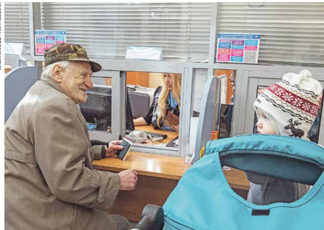
Социальные выплаты на детей и пожилым людям назначаются по принципу «одного окна». Для этого можно обратиться в клиентский центр регионального отделения СФР, в МФЦ, или подать заявление на портале Госуслуги