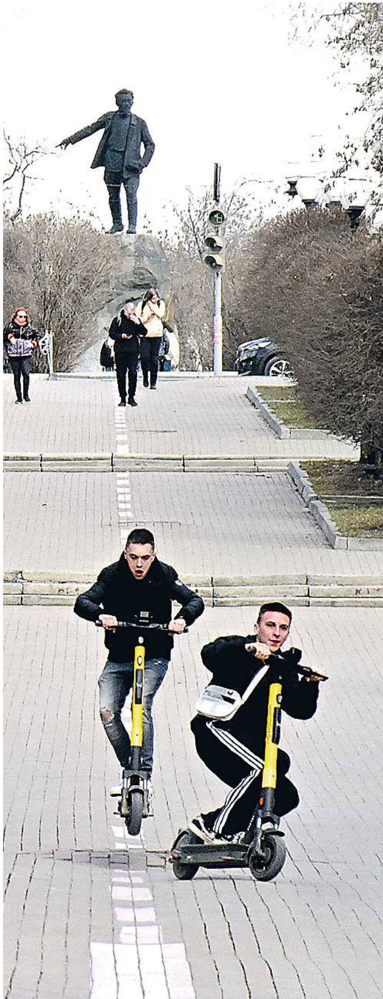
В парках и скверах электросамокатам предписано снижать скорость до 15 км/час

Их запрограммируют на соблюдение правил дорожного движения