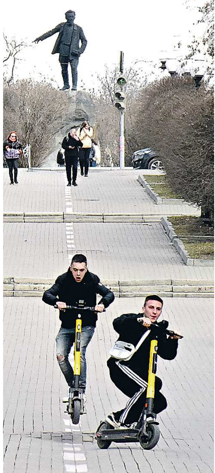
В парках и скверах электросамокатам предписано снижать скорость до 15 км/час

Их запрограммируют на соблюдение правил дорожного движения