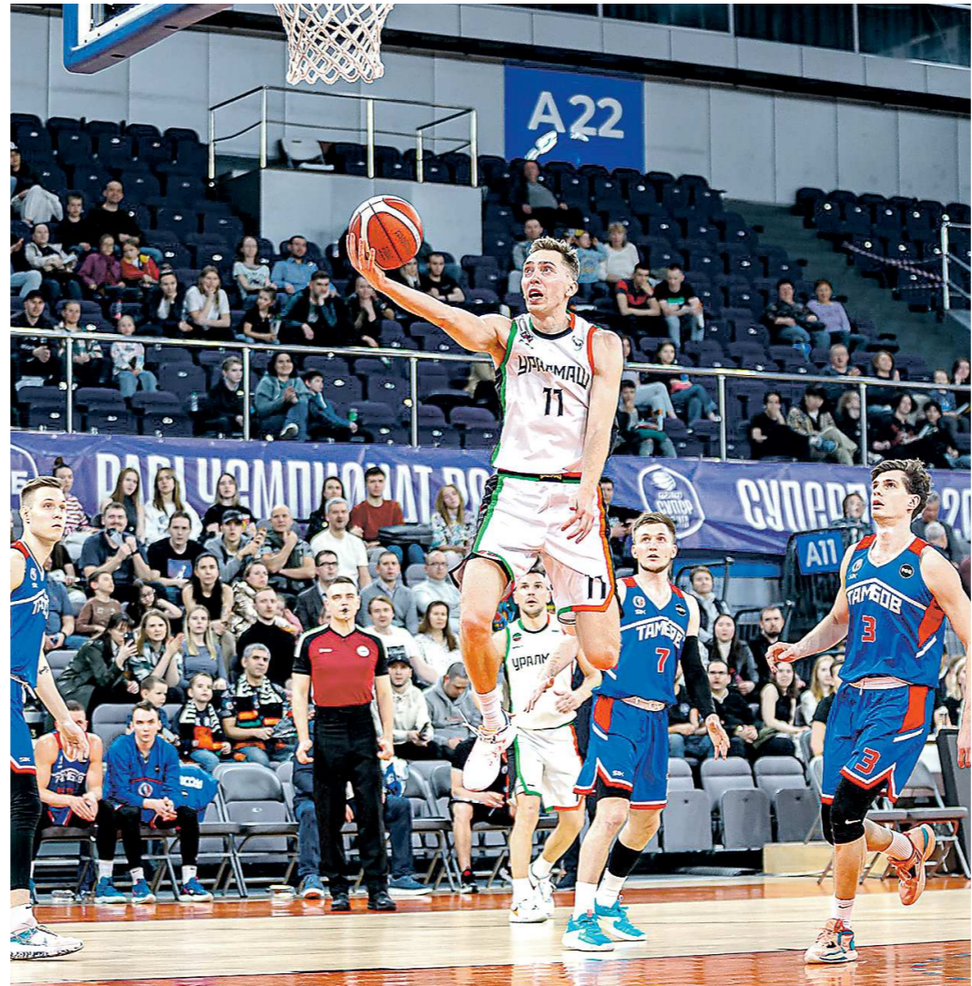
«Уралмаш» показал зрелищную игру во всех трех матчах против «Тамбова»