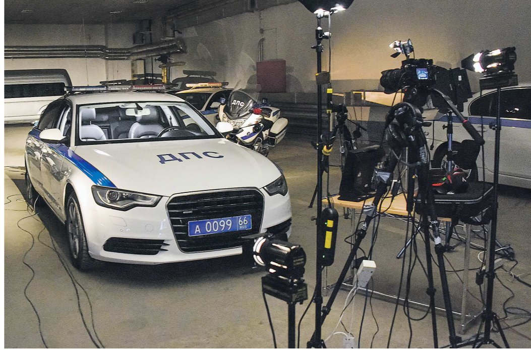
На то, чтобы выстроить «красивую картинку», ушло почти четыре часа

Локацию для прямого эфира телевизионщики выбрали, мягко сказать, необычную.